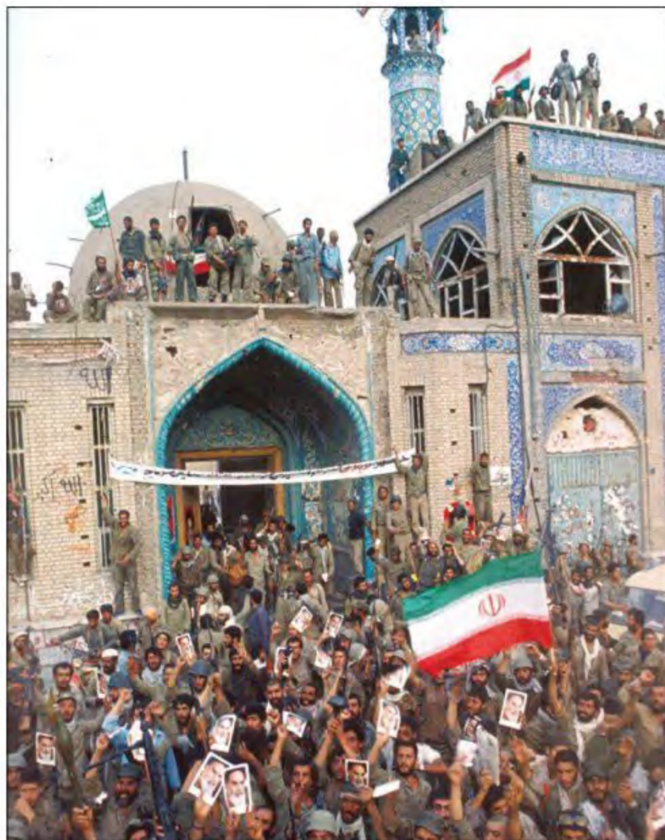
خرمشهر پس از آزادی - سوم خرداد ۱۳۶۱

1 پس از آنکه بنی صدر از مقام فرماندهی کل قوا و ریاست جمهوری عزل شد و اوضاع سیاسی کشور ثبات و آرامش یافت، رزمندگان اسلام با شجاعت و صلابت عزم خود را برای بیرون راندن دشمن متجاوز از خاک میهن عزیزمان جزم کردند. نخست، امام خمینی ره به عنوان فرمانده کل قوا، فرمان شکستن محاصره آبادان را صادر کردند؛ پس از آن رزمندگان ارتش، سپاه و بسیج در عملیاتی برق آسا، آبادان را از محاصره نیروهای متجاوز صدام نجات دادند. ۱ دلاورمردان ایران زمین سپس در چندین رشته عملیات غرورآفرین که مهم ترین آنها فتح المبین ۲ و بیت المقدس بودند، صدها کیلومتر مربع از خاک ایران را از اشغال ارتش بعثی آزاد کردند. اوج حماسه دفاع مقدس ملت ایران در عملیات بیت المقدس (سوم خرداد ۱۳۶۱) و با آزادی خونین شهر (خرمشهر) از اسارت دشمن بعثی رقم خورد و برگ زرینی در دفاع از ایران در تاریخ معاصر ثبت شد 1