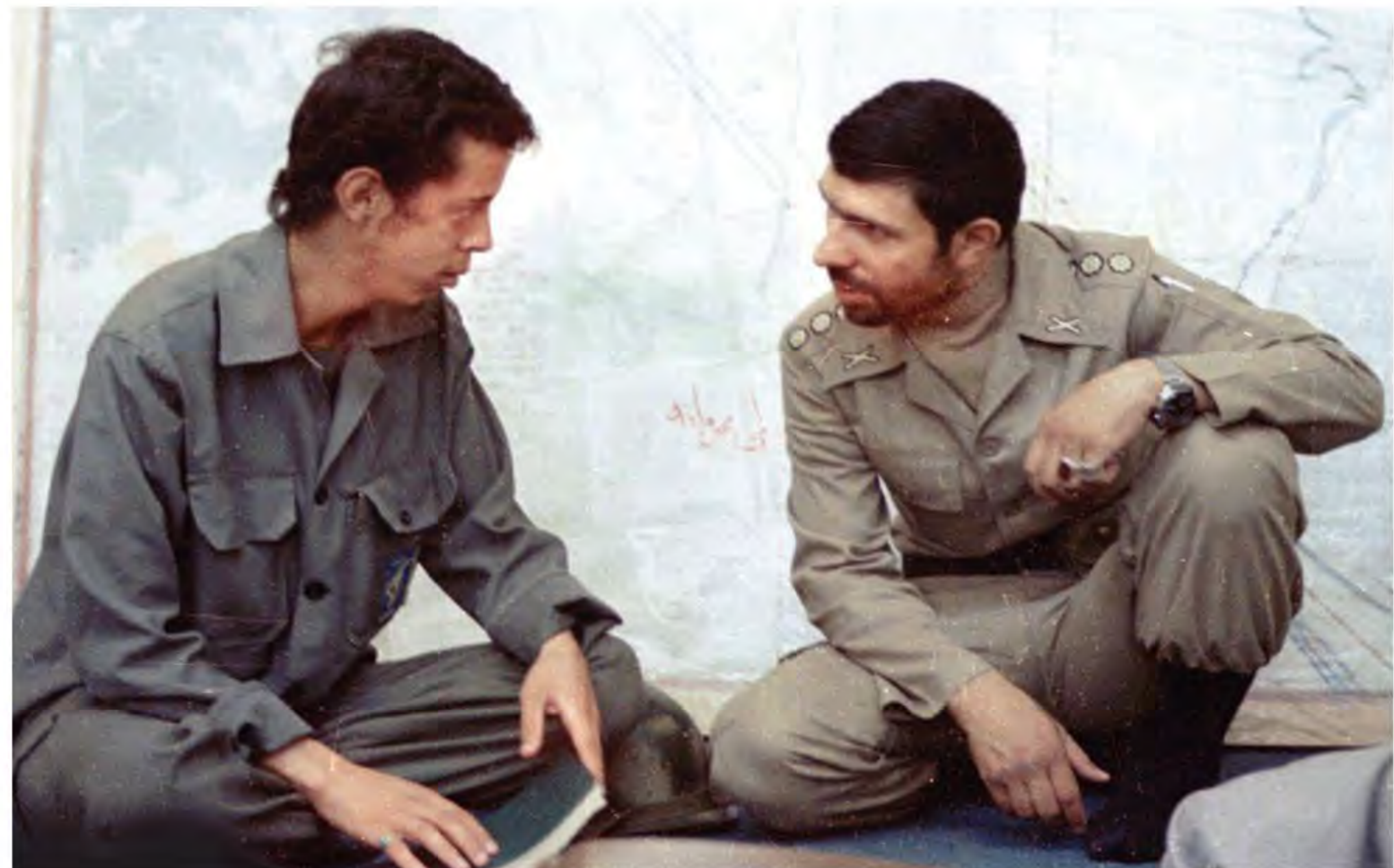
شهیدان سپهبد علی صیادشیرازی و سردار حسن باقری