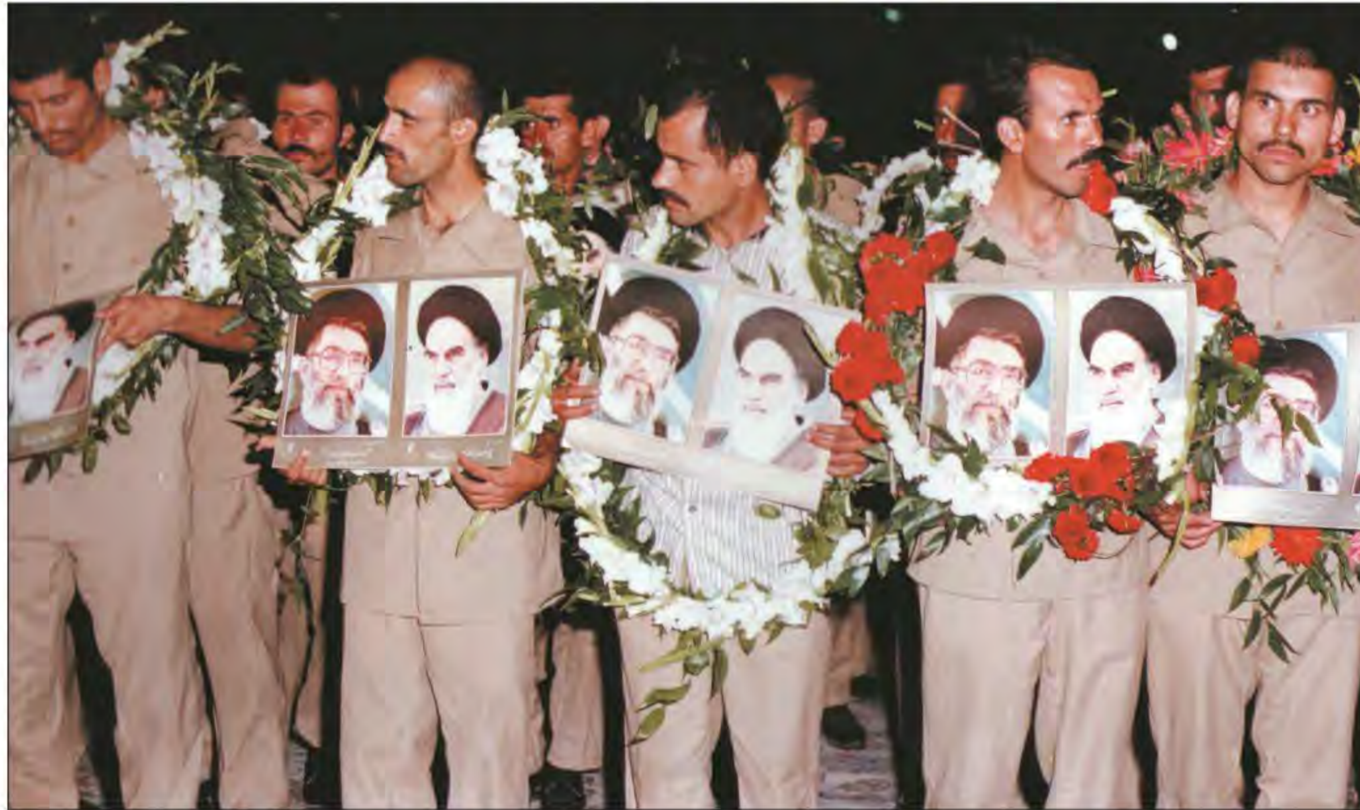
ورود گروهی از آزادگان (اسرا) به میهن عزیز

پس از برقراری آتش بس و دو سال مذاکره میان وزرای خارجه ایران و عراق، صدام در نامه ای به حجت الاسلام والمسلمین اکبر هاشمی رفسنجانی، رئیس جمهوری وقت ایران، قرارداد الجزایر را بار دیگر به رسمیت شناخت و اظهار داشت که شما به هر آنچه که می خواستید، رسیدید. پس از آن، آزادگان عزیز با استقبال گرم مردم ایران به آغوش میهن اسلامی بازگشتند. (2) در سال ۱۳۷۰ نیز سازمان ملل متحد رسماً رژیم بعثی عراق را به عنوان متجاوز و آغازکننده جنگ معرفی کرد. (3) به این ترتیب جنگ هشت ساله ای که صدام با حمایت آمریکا با هدف سرنگونی جمهوری اسلامی و تصرف بخشی از خاک ایران آغاز کرده بود، با شکست خود او به پایان رسید و برای اولین بار در دوست سال اخیر، دشمنان در جداسازی حتی یک وجب از خاک ایران ناکام ماندند (3) 3. صدام جنگ تحمیلی علیه ایران را با حمایت کدام کشور و با چه هدفی آغاز کرده بود؟ و نتیجه آن چه شد؟