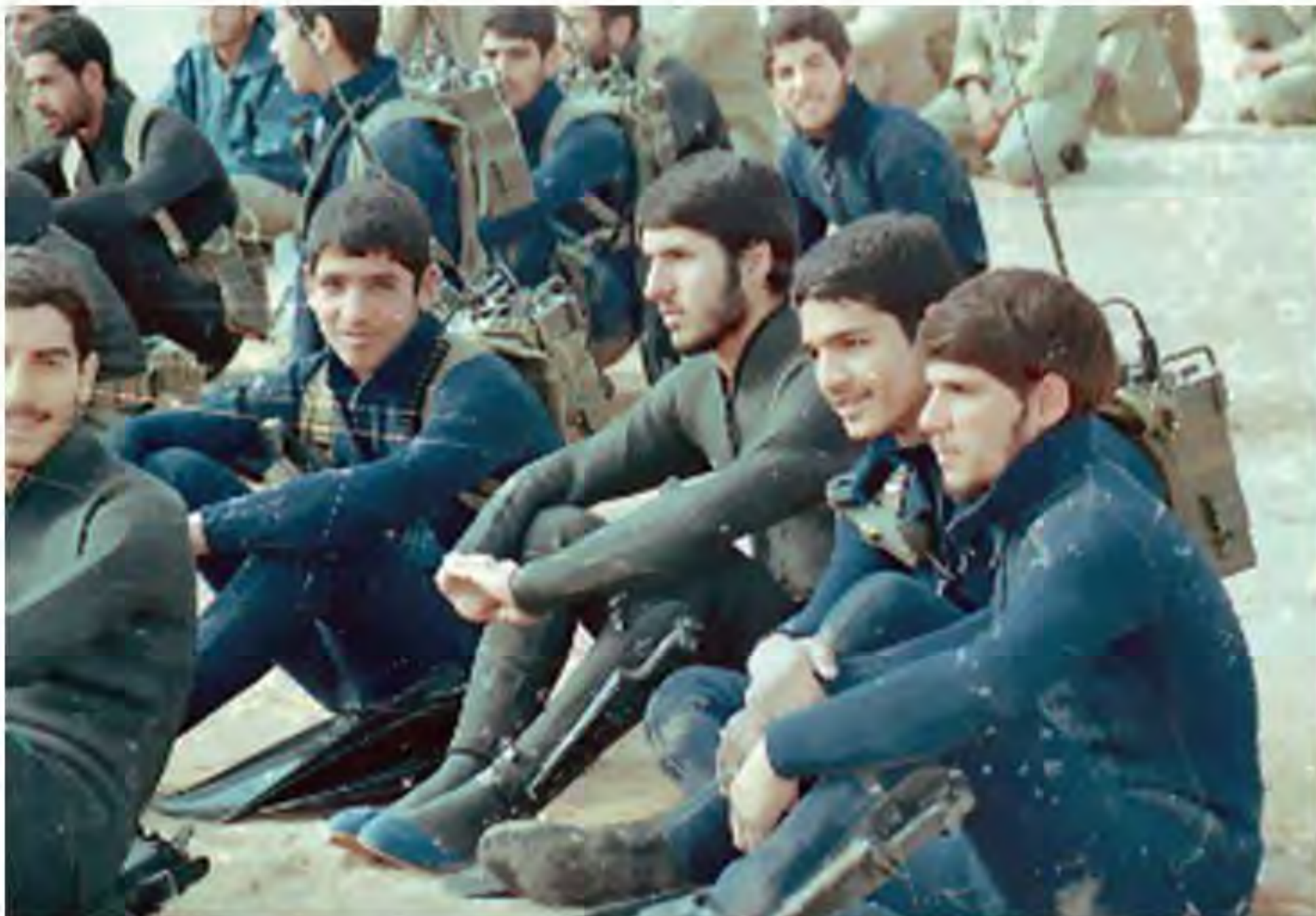
نوجوانان غواص ساعاتی قبل از عملیات

1) معلمان و دانش‌آموزان نیز نقش چشمگیر و تأثیرگذاری در هشت سال دفاع مقدس داشتند. در آن سال‌ها جبهه‌های جنگ شاهد حضور صدها هزار دانش‌آموز و معلم ایرانی بود که برای دفاع از کیان نظام اسلامی و سرزمین مادری به جبهه رفتند و در سنگرها نیز از درس و مشق غافل نماندند. در طول دفاع مقدس حدود ۲۵۰۰ معلم و نزدیک به ۳۶۰۰۰ دانش‌آموز به شهادت رسیدند و هزاران نفر هم جانباز، اسیر و جاویدالآثر شدند. 1