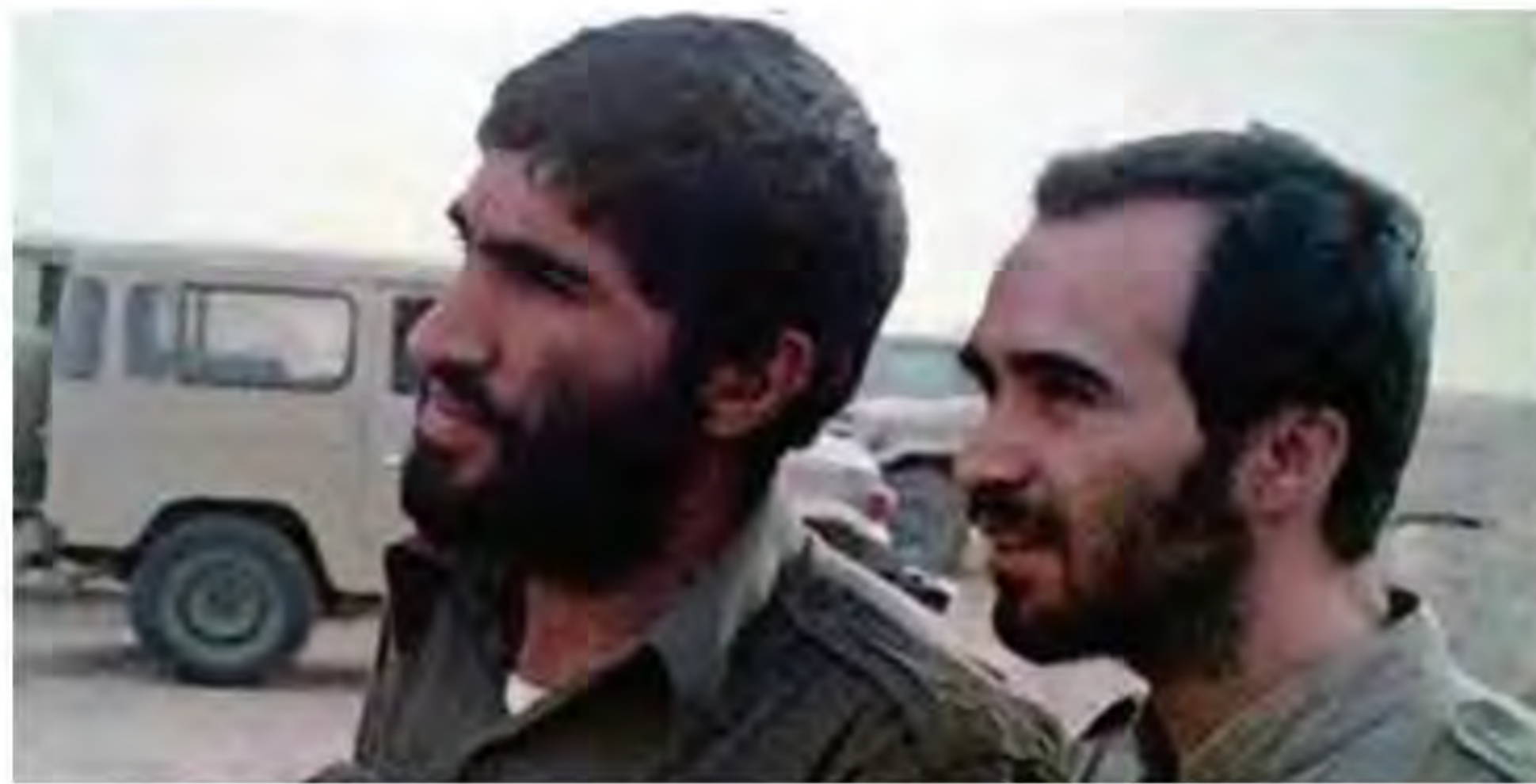
سردار شهید حسین خرازی، فرمانده لشکر ۱۴ امام حسین علیه السلام (شهادت: ۸ اسفند ۱۳۶۵ - شلمچه) و سردار شهید احمد کاظمی، فرمانده لشکر ۸ نجف‌اشرف (شهادت: دی ۱۳۸۴ - سانحه هوایی)

1) امام خمینی علیه السلام از ابتدای جنگ تحمیلی به صراحت اعلام کردند: «ما بر اساس اعتقاد و باور دینی خود اجازه نداریم به کشور دیگری تعدی کنیم و میل داریم در همه جای دنیا صلح و صفا باشد اما اگر کشوری به ما تعدی کرد، توی دهنش می‌زنیم». 1 بر اساس همین منطق نیز با شروع تجاوز نظامی رژیم بعثی عراق از همه قشرهای ملت خواستند که برای دفاع از ایران به سوی جبهه‌های نبرد بشتابند. همچنین به مسئولان توصیه کردند که جنگ را مسئله اصلی کشور بدانند و برای پیشبرد آن تا پیروزی نهایی بر دشمن، به رزمندگان و مردم یاری برسانند. اهتمام فراوان حضرت امام خمینی علیه السلام بر تقویت بنیه دفاعی و حمایت‌های ایشان برای بالا بردن کیفیت و کمیت امکانات و تجهیزات نظامی و تأمین بودجه‌های جنگ نیز از جمله تدابیر رهبری ایشان در طول دفاع مقدس بود که تا روزهای پایانی جنگ ادامه داشت، اما مهم‌ترین اقدام ایشان ایجاد تحول در روح و روان جوانان ایرانی بود. امام خمینی علیه السلام با تمسک به مفاهیم جهاد و شهادت و یادآوری حماسه عاشورا، میدان نبرد را به صحنه نمایش رشادت و شجاعت جوانان ایرانی تبدیل کردند. آنان در سایه ایمان و اعتقاد و خلاقیت خاص خویش همه محاسبات نظامی رایج در دنیا را بر هم زدند و با طراحی و انجام دادن عملیات‌های خارق العاده زمینی، هوایی و دریایی، افسران نظامی جهان را به شگفتی واداشتند. در نتیجه رهبری امام خمینی علیه السلام جلوه‌های زیبایی از ایثار و فداکاری در راه دین و میهن و همچنین تقویت انگیزه جهاد و روحیه شهادت‌طلبی در میان جوانان ایرانی به نمایش گذاشته شد. 1 برخی از فرماندهان جوان دوران دفاع مقدس، امروز به نماد رشادت و مقاومت مردم سوریه و عراق علیه گروه‌های تکفیری و داعشی تبدیل شده‌اند.