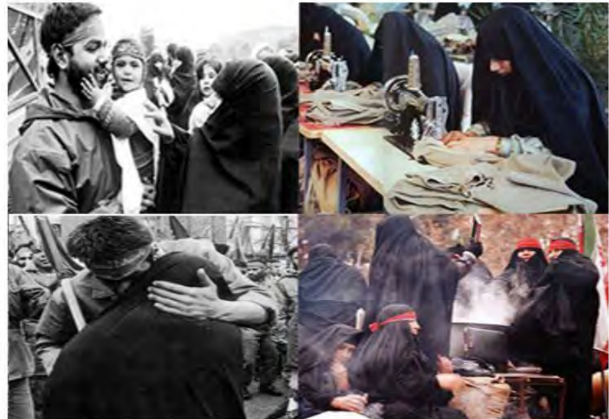
مشارکت مؤثر در دفاع مقدس