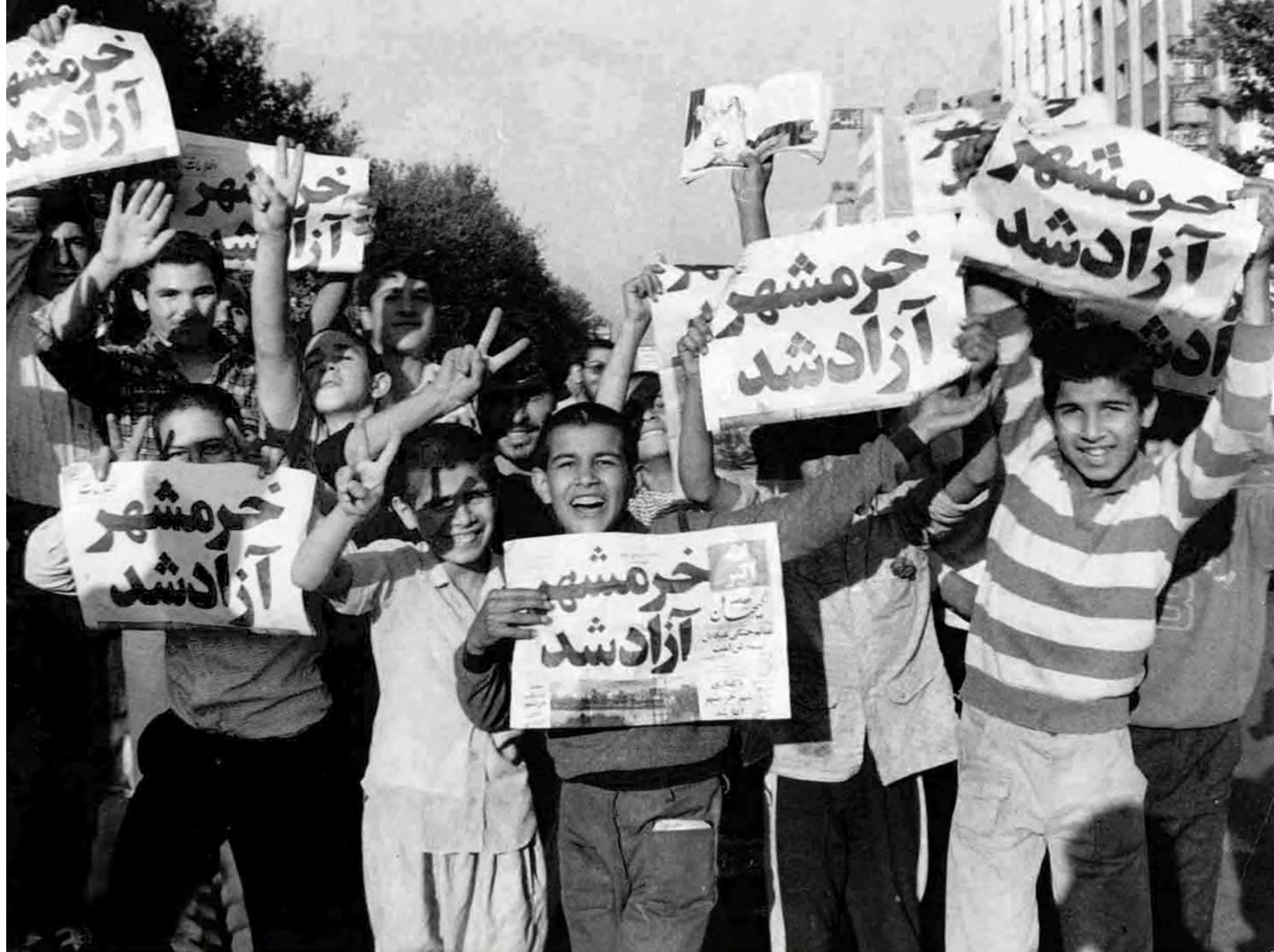
شادی دانش آموزان پس از آزادی خرمشهر