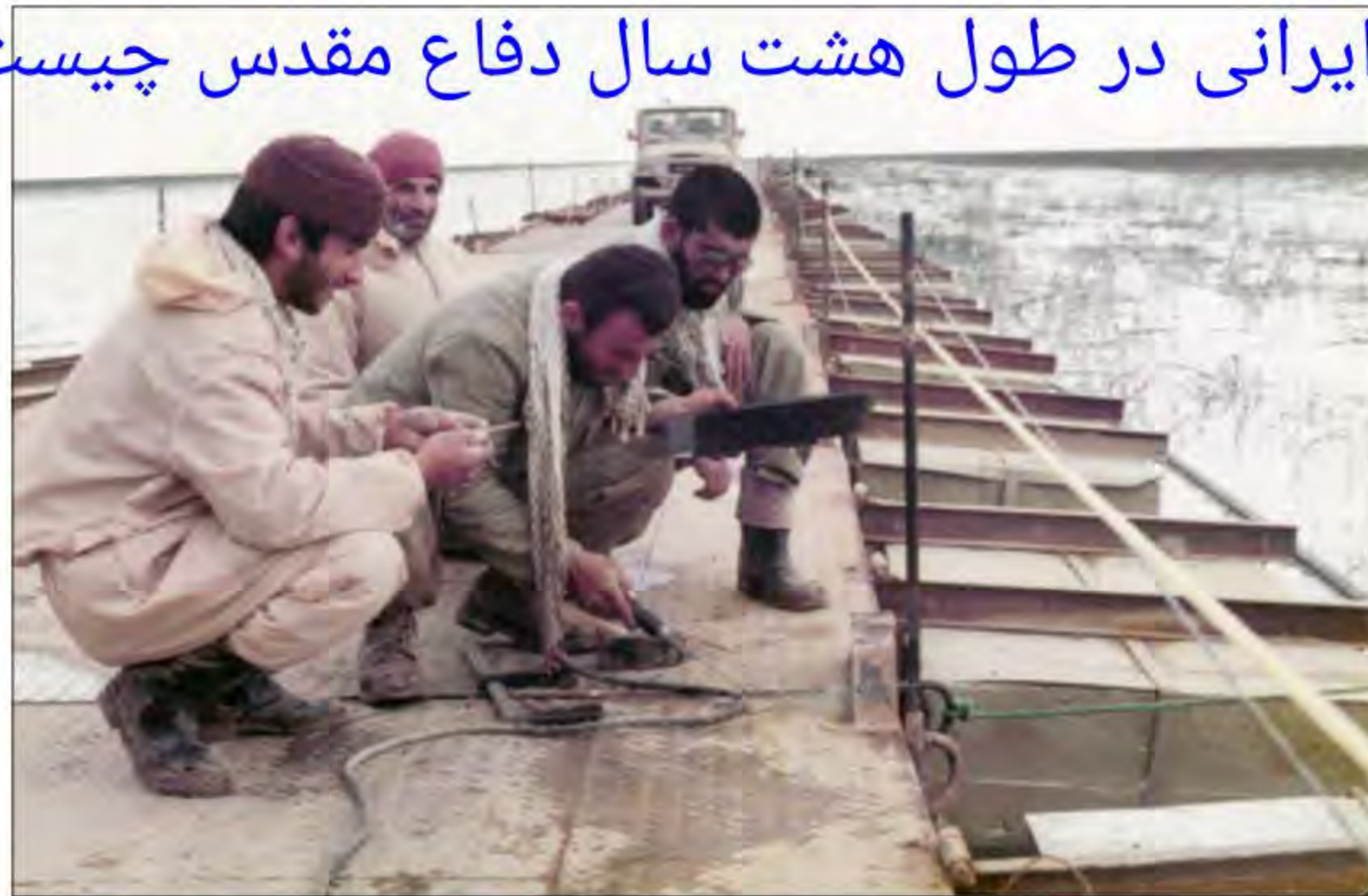
ساخت پل شناور خیبر بر روی هور العظیم یکی از شاهکارهای مهندسی رزمی جهادگران در دوران دفاع مقدس بود.