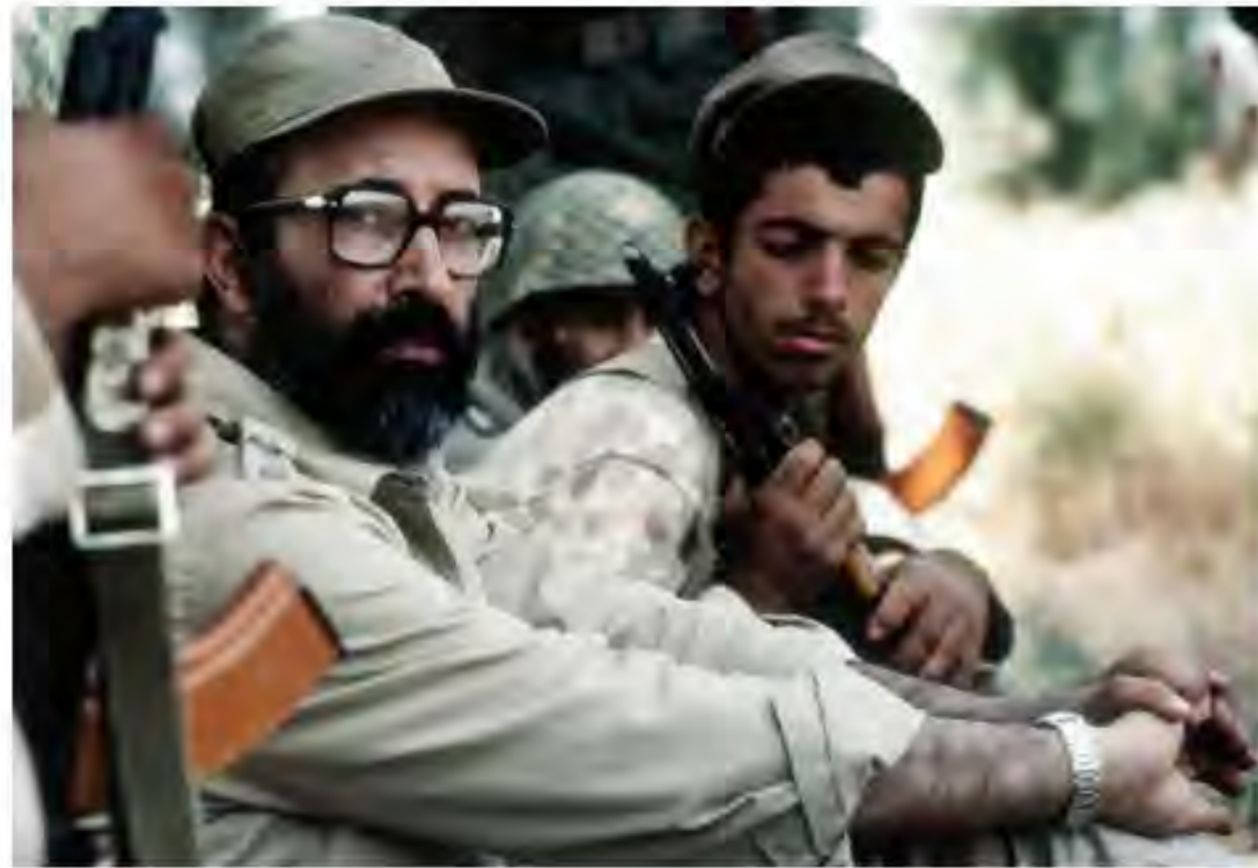
شهید مصطفی چمران

1) نیروی هوایی ارتش جمهوری اسلامی از نخستین ساعت‌های شروع جنگ وارد عمل شد و با رشادت و شجاعت تمام، ضربه مهلکی به رژیم صدام وارد آورد. (در جبهه زمینی نیز رزمندگان ارتش، سپاه پاسداران و ژاندارمری به همراه مردم شهرها و