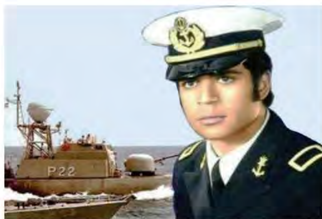
شهید محمدابراهیم همتی فرمانده ناوچه پیکان که در عملیات مروارید به شهادت رسید.

5. نتیجه مقاومت دلیرانه و شجاعانه مردم ایران و نیروهای مسلح چه بود؟