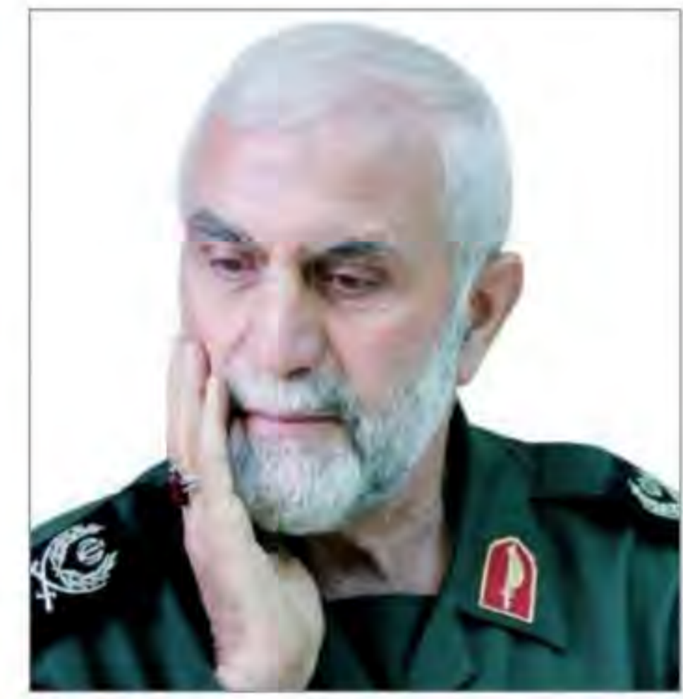
سردار شهید حسین همدانی (شهادت: ۱۳۹۶ - حلب سوریه)