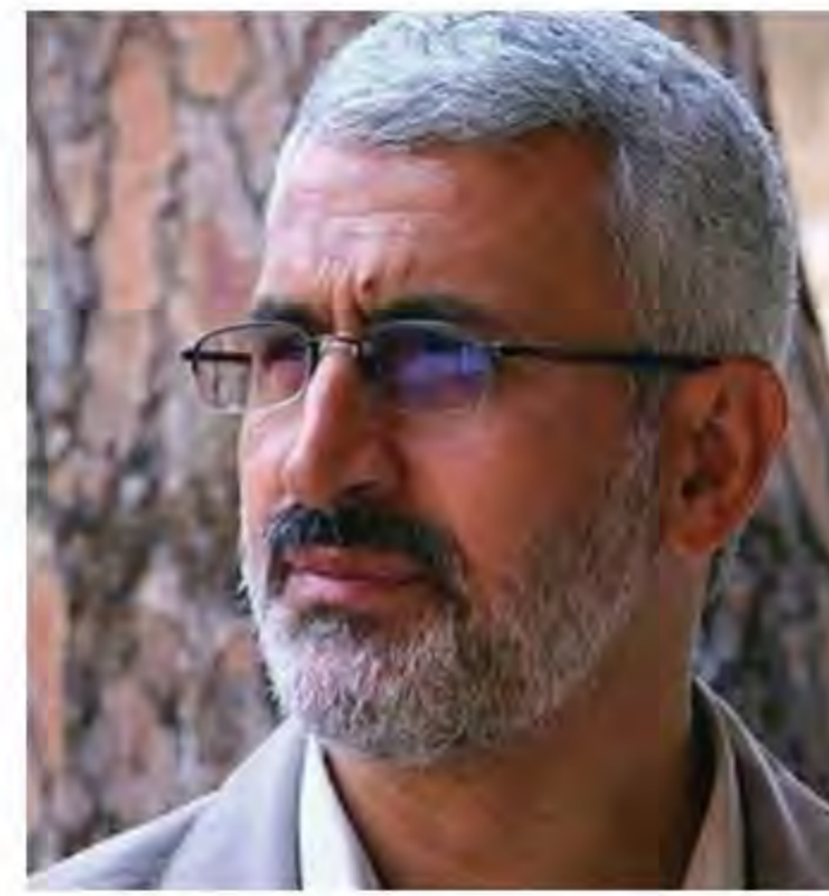
سردار شهید حسن شاطری (شهادت: ۱۳۹۱ - لبنان)