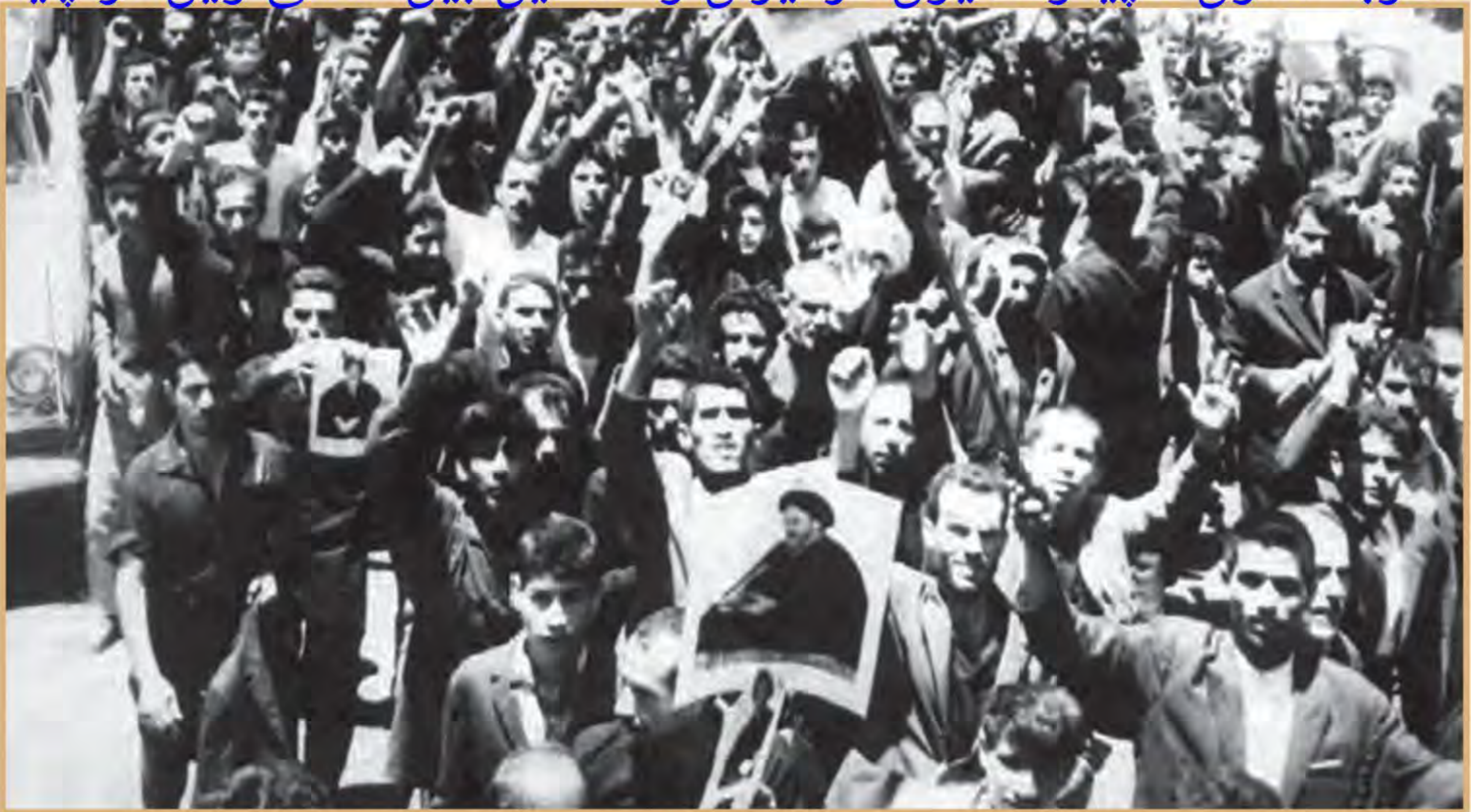
نمایی از تظاهرات مردم تهران در ۱۵ خرداد ۱۳۴۲