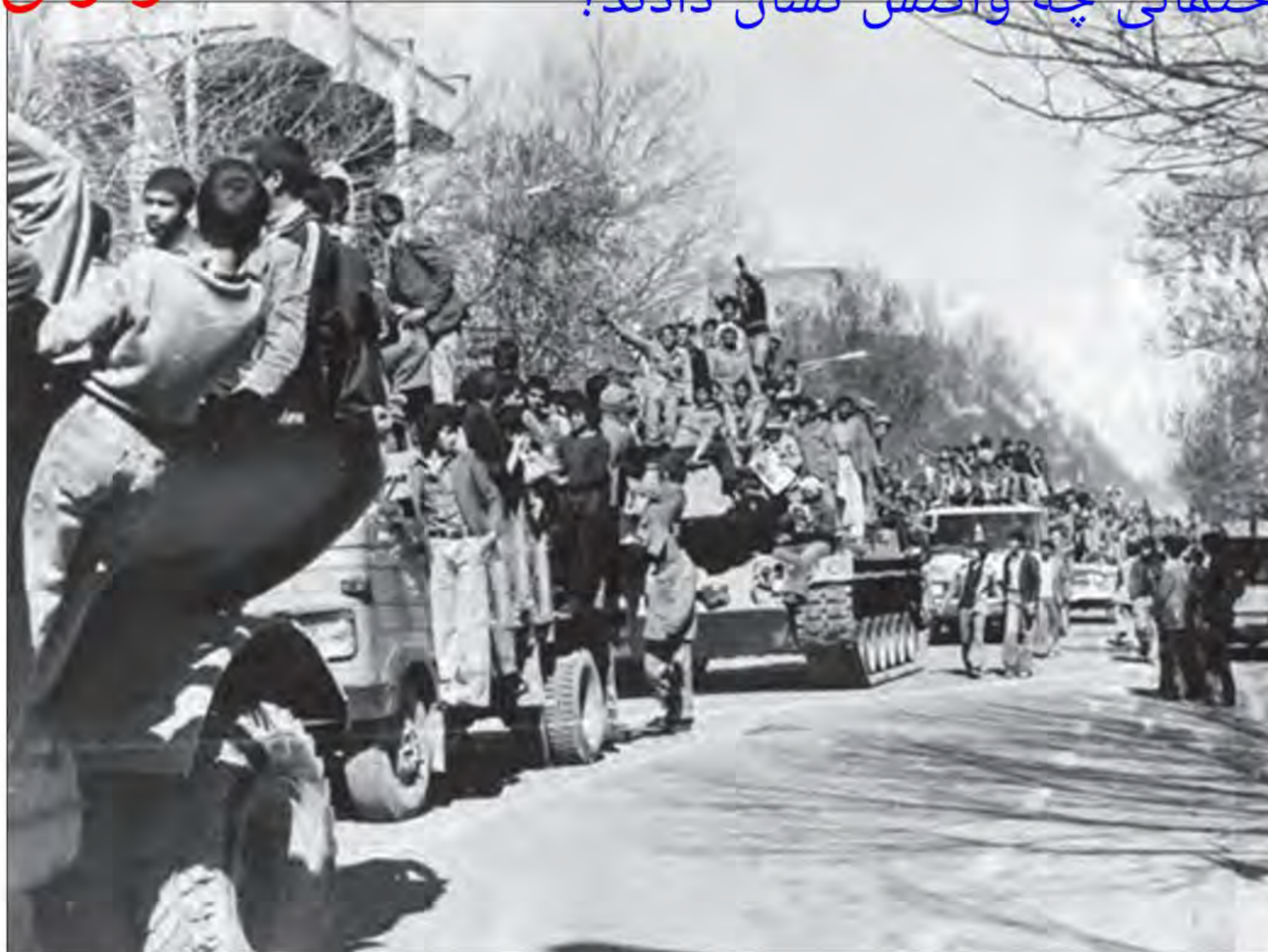
تهران - ۲۲ بهمن ۱۳۵۷

5. مردم در برابر کودتای احتمالی چه واکنش نشان دادند؟