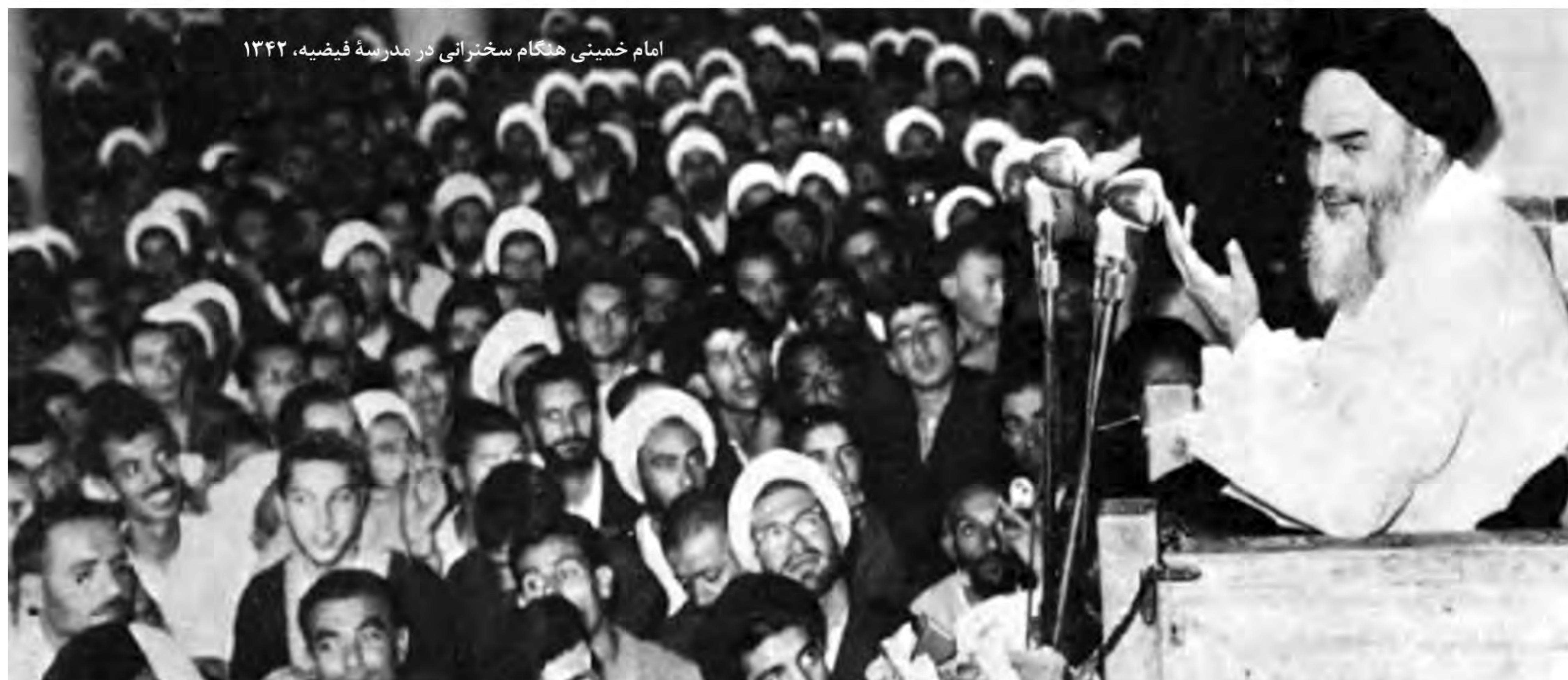
امام خمینی هنگام سخنرانی در مدرسه فیضیه، ۱۳۴۲

۱- اسناد لانه جاسوسی آمریکا، ۱۳۸۶، ج ۱، ص ۲۶۸