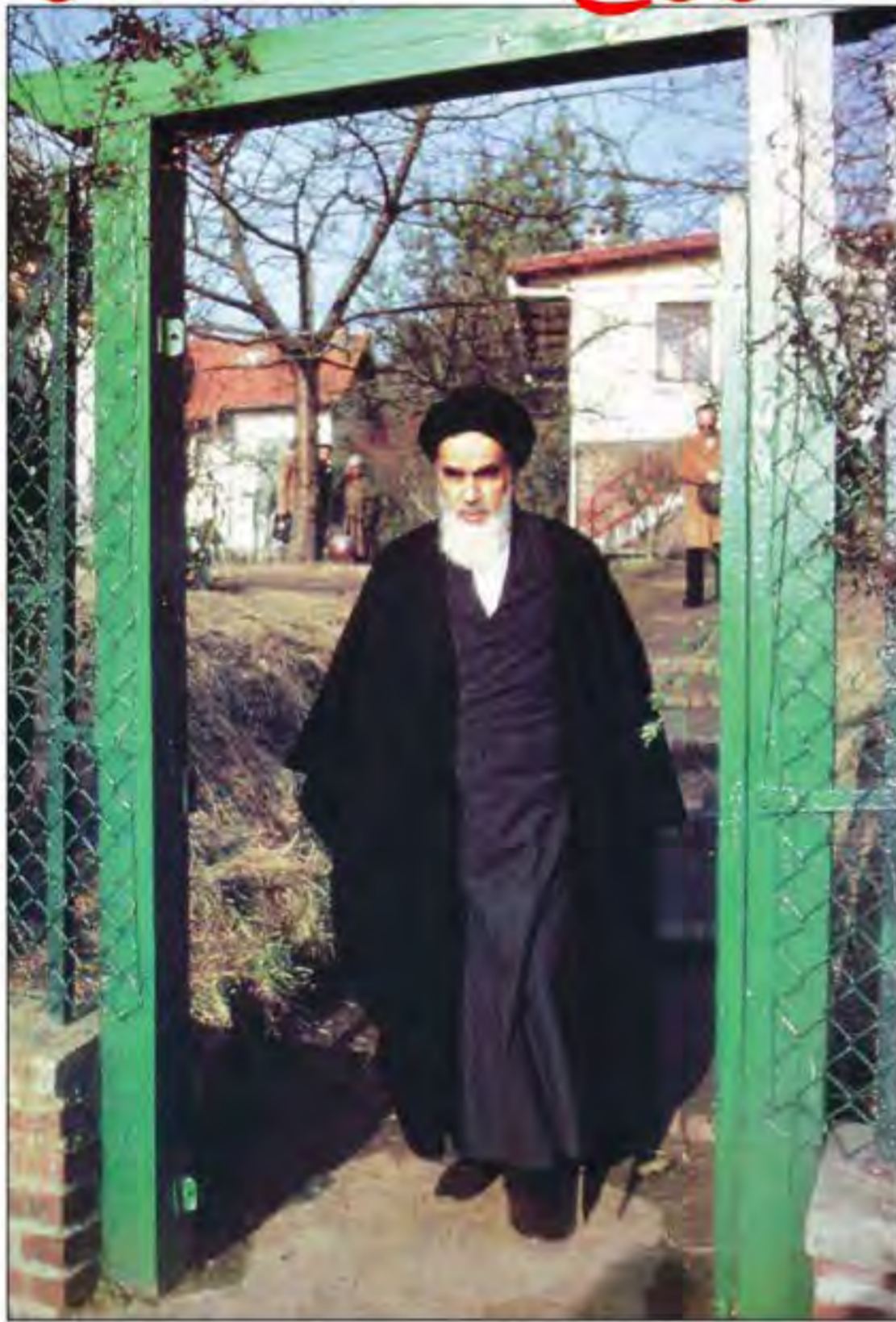
حضرت امام خمینی در نوفل لوشاتو