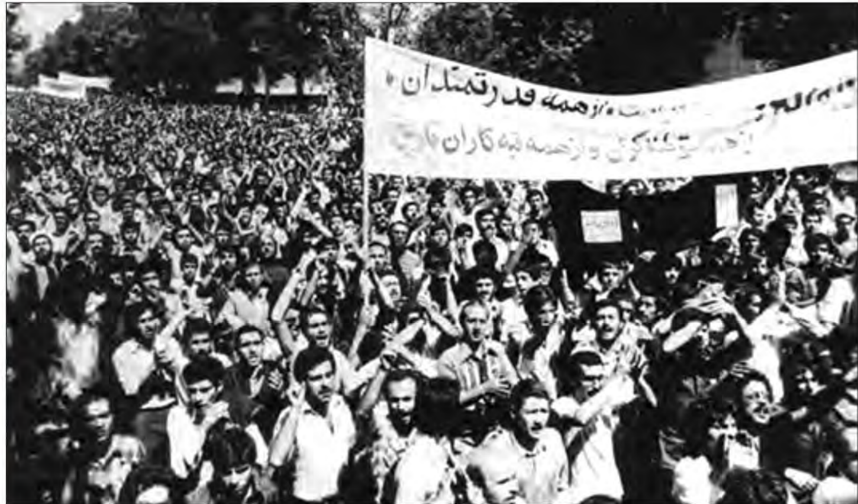
تظاهرات مردم تهران در شهریور ۱۳۵۷