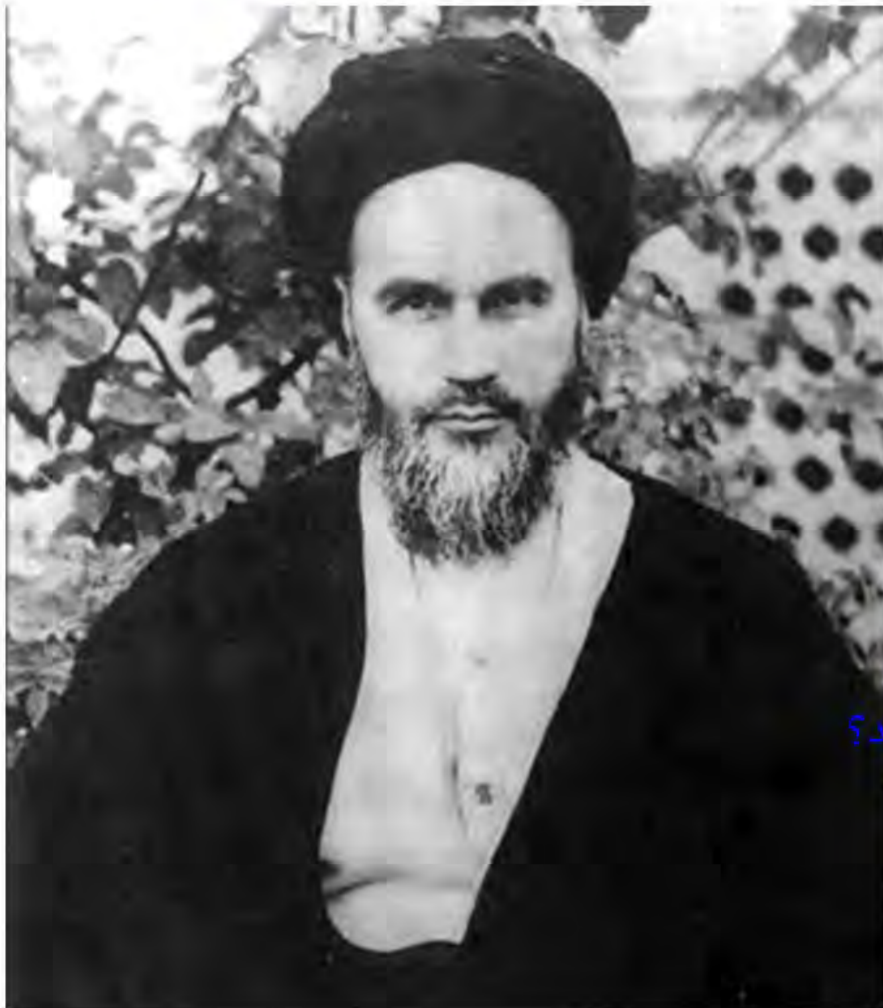
امام خمینی، رهبر نهضت اسلامی