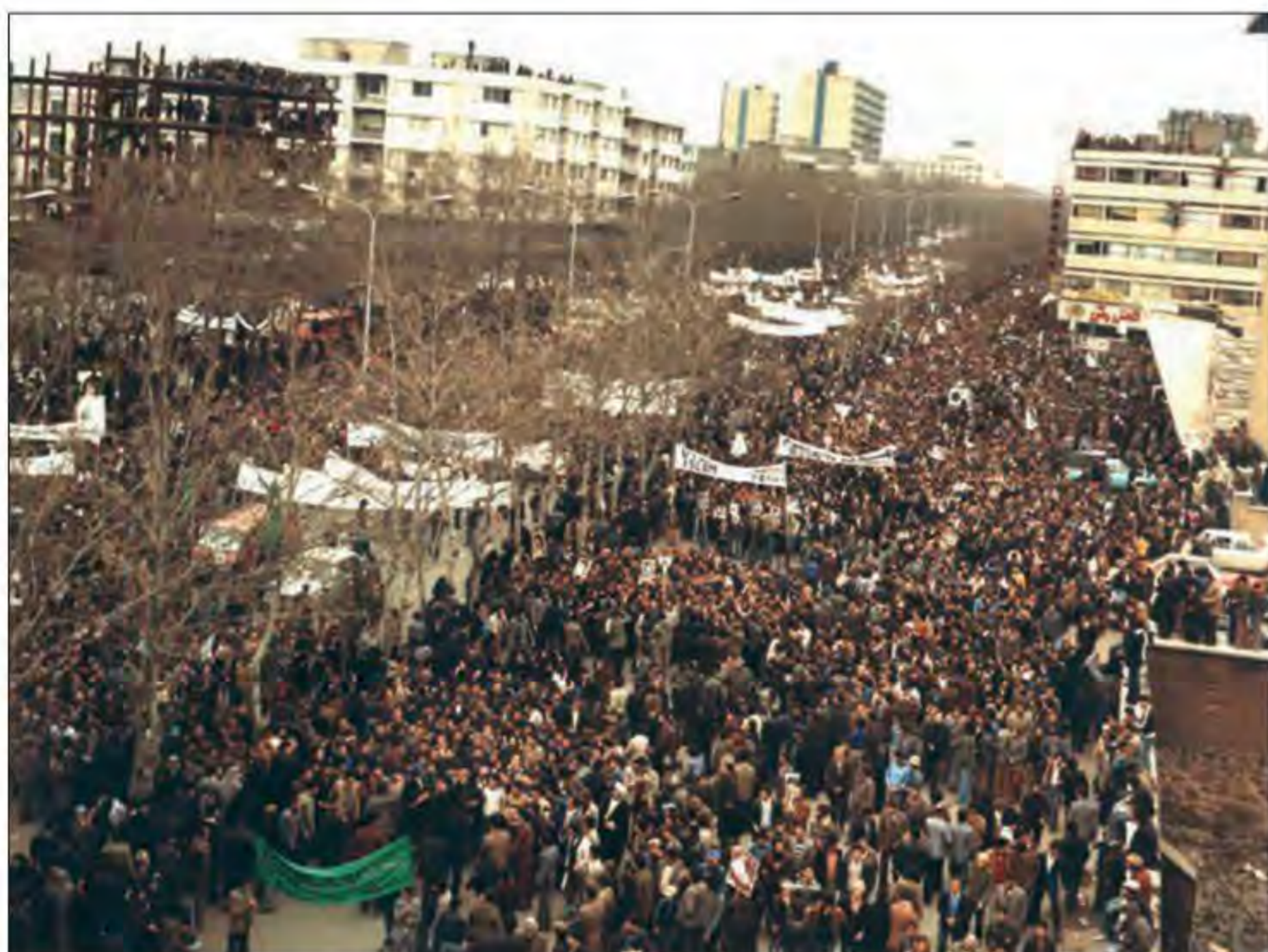
راه‌پیمایی میلیونی مردم تهران در تاسوعای حسینی، ۱۹ آذر ۱۳۵۷

حماسه ماه محرم شاه پس از سرکوب تظاهرات دانشجویان و دانش‌آموزان در مقابل دانشگاه تهران (۱۳ آبان)، ارتشبد غلامرضا ازهاری را جانشین شریف امامی کرد تا وی با برقرار کردن حکومت نظامی از سرعت حرکت انقلاب بکاهد. اما شروع ماه محرم، مبارزه را وارد مرحله تازه‌ای کرد. در روزهای تاسوعا و عاشورا میلیون‌ها تن از مردم در شهرهای مختلف، از جمله تهران، با شرکت در تظاهراتی مسالمت‌آمیز سقوط حکومت پهلوی و برقراری حکومت اسلامی را فریاد زدند.