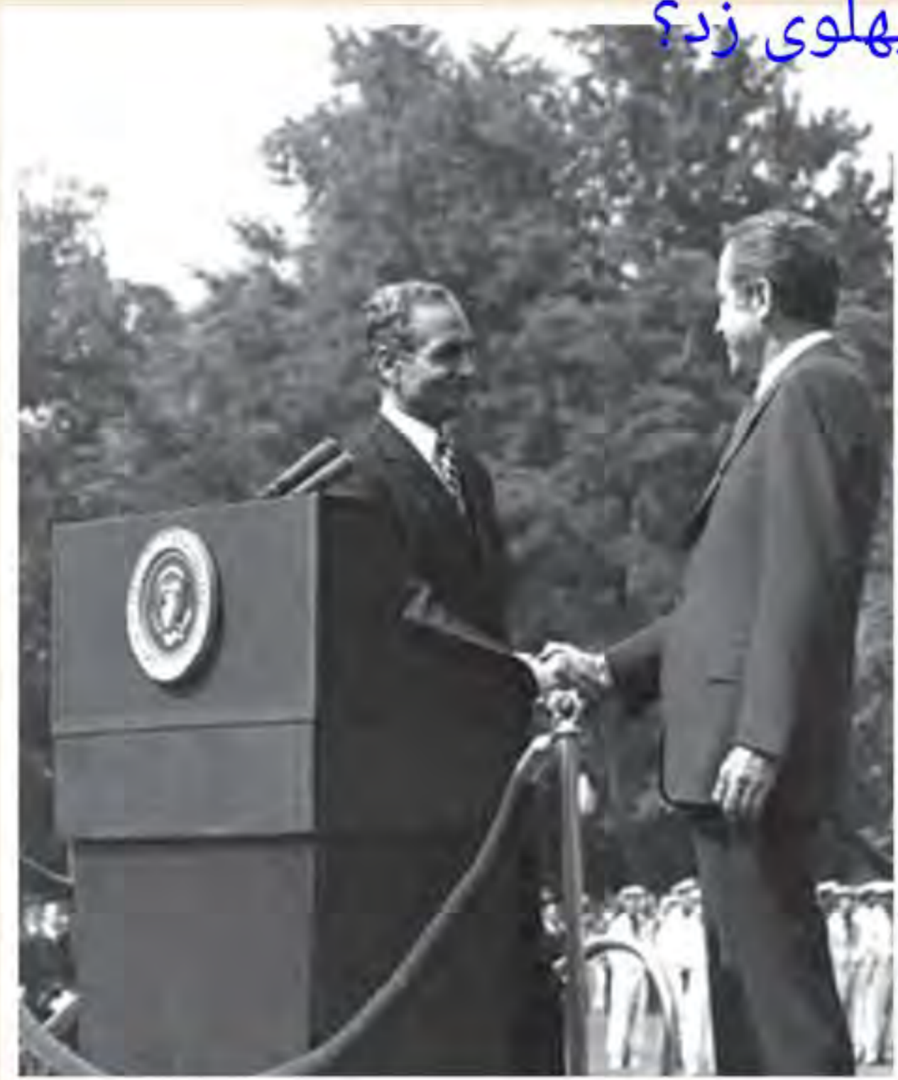
محمدرضا شاه پهلوی هنگام ملاقات با نیکسون رئیس جمهور آمریکا

پس از تبعید امام خمینی و سرکوب شدید مخالفان، اوضاع سیاسی آرام تر شد 1 (همچنین با افزایش چشمگیر درآمدهای نفتی ایران در دوران طولانی نخست وزیری امیرعباس هویدا، حکومت پهلوی برای تقویت و تحکیم پایه های اقتدار خود به اقداماتی نمایشی دست زد) 1 برگزاری جشن تاج گذاری و جشن های دوهزار و پانصد ساله شاهنشاهی، منحل کردن احزاب موجود و ایجاد حزبی واحد به نام حزب رستاخیز از جمله این اقدامات بود 2 با این حال وضعیت زندگی و معیشت عموم مردم که بیشتر در روستاها زندگی می کردند، مناسب نبود و در بیشتر نقاط ایران روستانشین ها در فقر و بی سوادى به سر می بردند. در زمینه فرهنگی نیز رژیم پهلوی کوشید میان فرهنگ ایرانی و فرهنگ اسلامی تقابلی مصنوعی ایجاد کند. پیرو همین سیاست 4 (به بهانه ناهمخوانی تاریخ هجری شمسی با فرهنگ ایرانی، تاریخ شاهنشاهی را جایگزین تقویم هجری شمسی کرد) 3