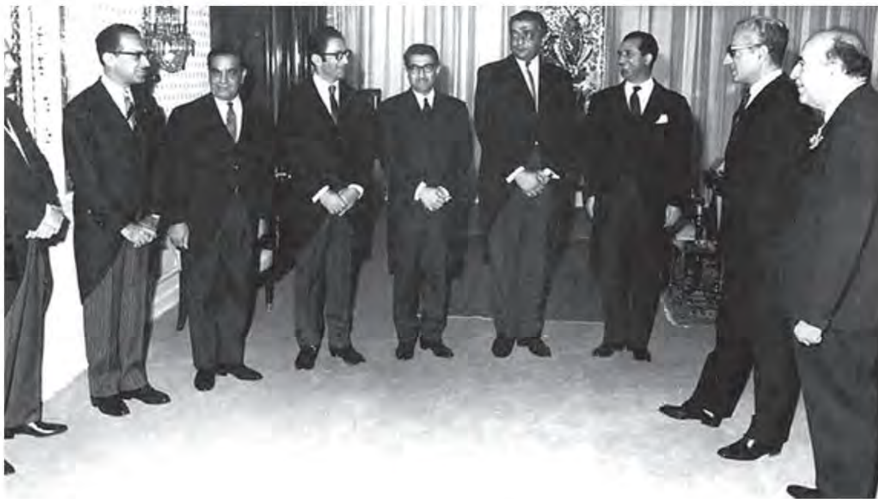
امیرعباس هویدا هنگام معرفی اعضای کابینه خود به شاه

پس از تبعید امام خمینی و سرکوب شدید مخالفان، اوضاع سیاسی آرام تر شد 1 (همچنین با افزایش چشمگیر درآمدهای نفتی ایران در دوران طولانی نخست وزیری امیرعباس هویدا، حکومت پهلوی برای تقویت و تحکیم پایه های اقتدار خود به اقداماتی نمایشی دست زد) 1 برگزاری جشن تاج گذاری و جشن های دوهزار و پانصد ساله شاهنشاهی، منحل کردن احزاب موجود و ایجاد حزبی واحد به نام حزب رستاخیز از جمله این اقدامات بود 2 با این حال وضعیت زندگی و معیشت عموم مردم که بیشتر در روستاها زندگی می کردند، مناسب نبود و در بیشتر نقاط ایران روستانشین ها در فقر و بی سوادى به سر می بردند. در زمینه فرهنگی نیز رژیم پهلوی کوشید میان فرهنگ ایرانی و فرهنگ اسلامی تقابلی مصنوعی ایجاد کند. پیرو همین سیاست 4 (به بهانه ناهمخوانی تاریخ هجری شمسی با فرهنگ ایرانی، تاریخ شاهنشاهی را جایگزین تقویم هجری شمسی کرد) 3