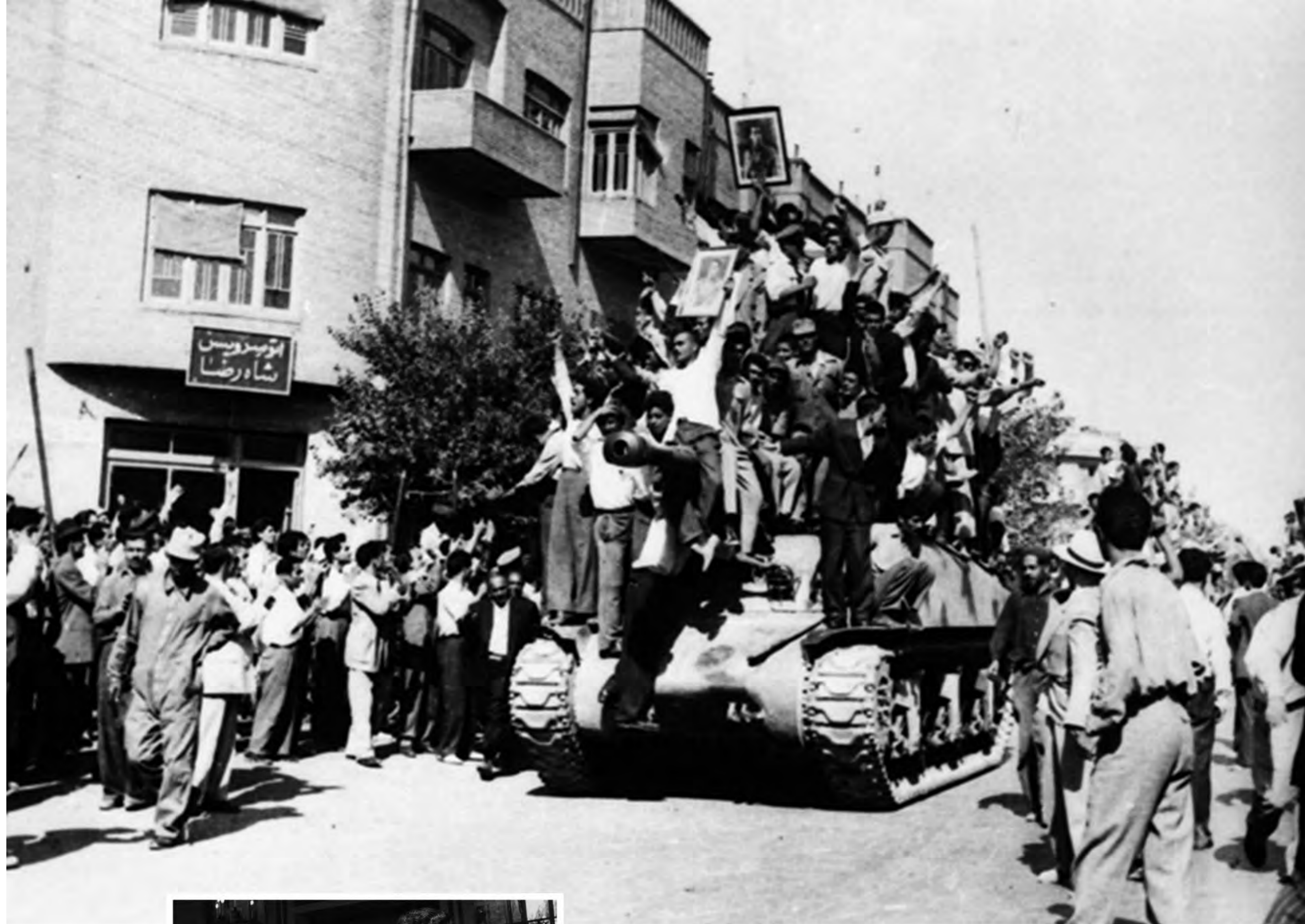
کودتاجیان در خیابان‌های تهران - ۲۸ مرداد ۱۳۳۲