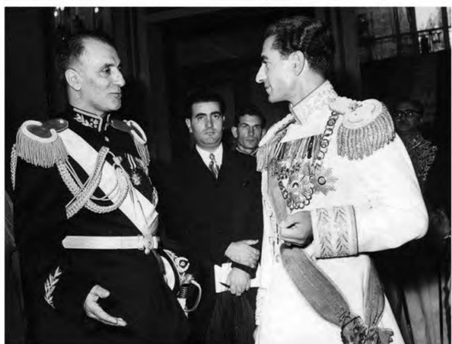
شاه و سرلشکر زاهدی، فرمانده کودتاجیان