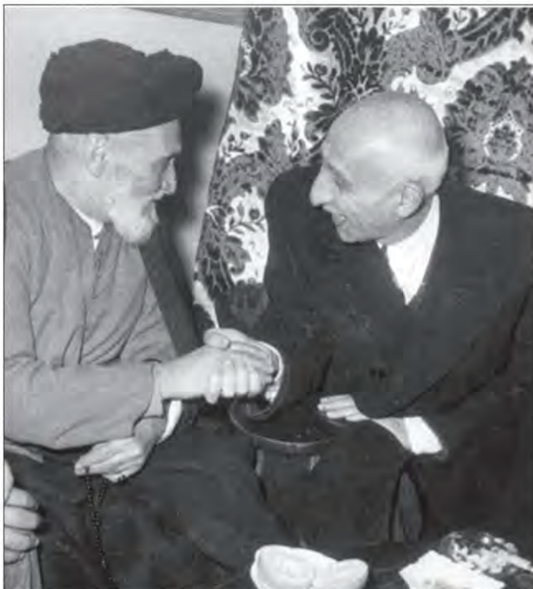
دکتر مصدق و آیت الله کاشانی

1) نمایندگان مخالف قرارداد الحاقی در مجلس شانزدهم، ضمن مخالفت با این قرارداد، طرح ملی شدن صنعت نفت ایران را پیشنهاد کردند. 2) این طرح با استقبال گسترده شخصیت‌ها، قشرها و گروه‌های مختلف سیاسی، ملی و مذهبی روبه‌رو شد و بسیاری از مطبوعات نیز از آن پشتیبانی کردند. تظاهرات و اعتصاب‌هایی هم در مخالفت با قرارداد الحاقی و طرف‌داری از ملی شدن صنعت نفت برپا شد. آیت‌الله سید ابوالقاسم کاشانی، که سابقه طولانی در مبارزه با استعمار انگلستان داشت، با جدیت تمام از جنبش ملی شدن صنعت نفت حمایت کرد. وی در اعلامیه‌ای، مبارزه برای ملی شدن نفت را تکلیف دینی و وطنی ملت ایران برشمرد و تعدادی از علما نیز نظر او را تأیید کردند. 2)