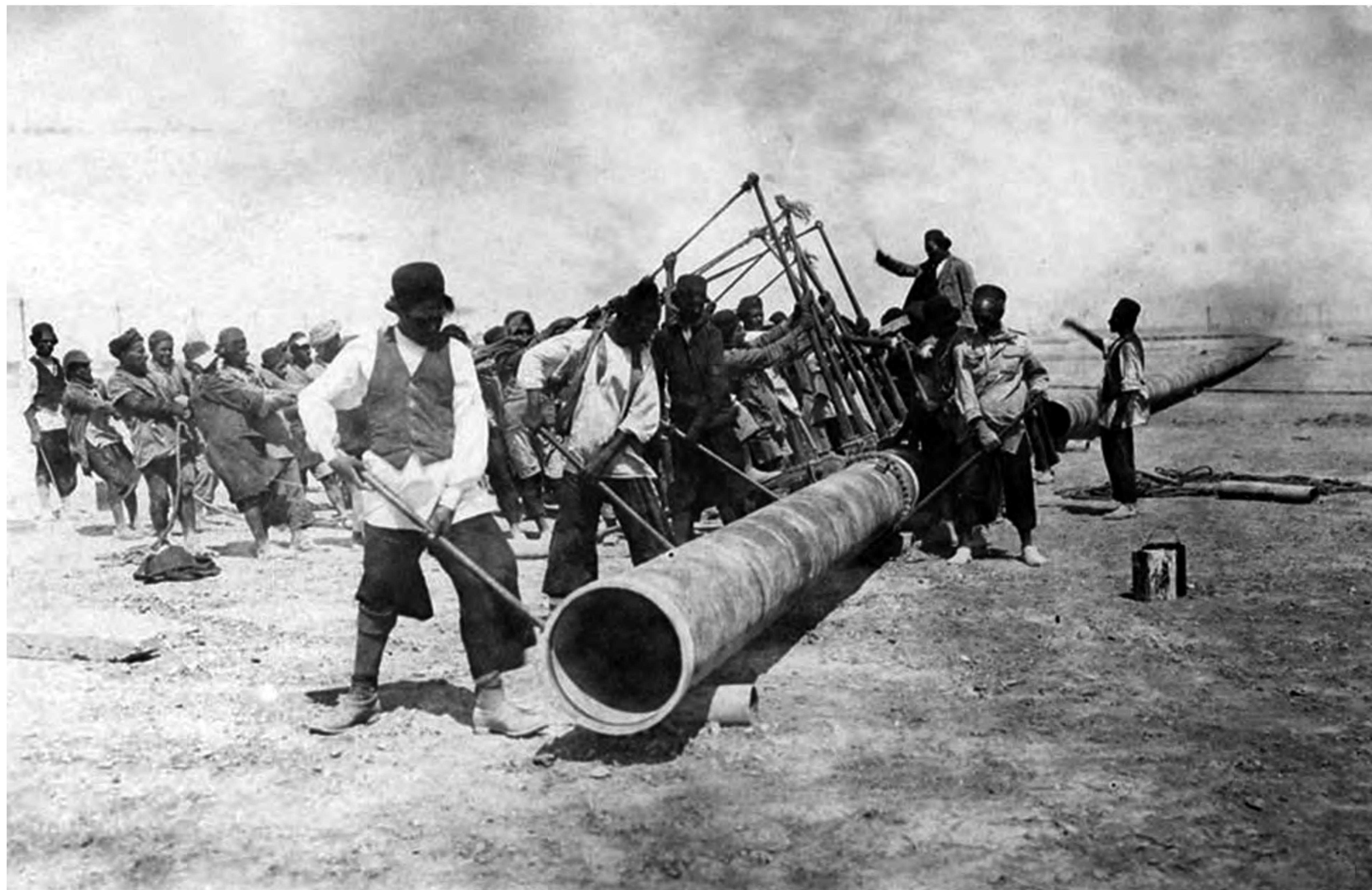
کارگران شرکت نفت هنگام احداث خط لوله نفت در خوزستان

1) به نام «شرکت نفت پارس و انگلیس» ۱ تشکیل شد. این شرکت چاه‌های زیادی در منطقه مسجد سلیمان حفر کرد و خط لوله‌ای هم از آنجا تا آبادان کشید ۲ دولت انگلستان پس از آنکه از ارزش منابع عظیم نفت ایران و اهمیت آن برای نیروی دریایی خود آگاه شد، ۵۱ درصد سهام شرکت نفت پارس و انگلیس را خریداری کرد و حق نظارت کامل بر آن شرکت را به دست آورد (۱۹۱۴م). بدین گونه این شرکت به بازوی پر قدرت اقتصادی و سیاسی دولت انگلیس تبدیل شد و زمینه اعمال نفوذ و مداخله بیشتر انگلیسی‌ها را در ایران فراهم آورد ۲