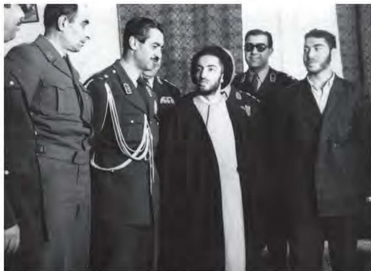
شهیدان نواب صفوی و سید محمد واحدی لحظاتی پس از بازداشت در حضور سرلشکر تیمور بختیار، فرماندار نظامی تهران