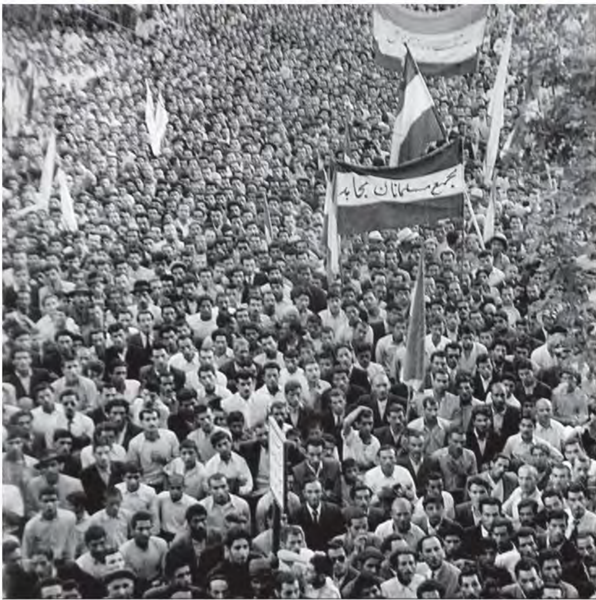
صحنه‌ای از تظاهرات مردم تهران در پشتیبانی از ملی شدن صنعت نفت ایران