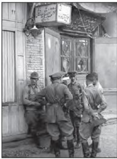
نیروهای انگلیسی در ایران-جنگ جهانی دوم نظامیان شوروی در ایران- قزوین-جنگ جهانی دوم

۱/۵ ۵. تصویر مقابل به موقعیت ایران در جنگ جهانی دوم اشاره دارد. با توجه به اینکه ایران در جنگ جهانی دوم اعلام بیطرفی نمود دلایل حضور این نیروها در ایران را بررسی و ارزیابی نمایید.