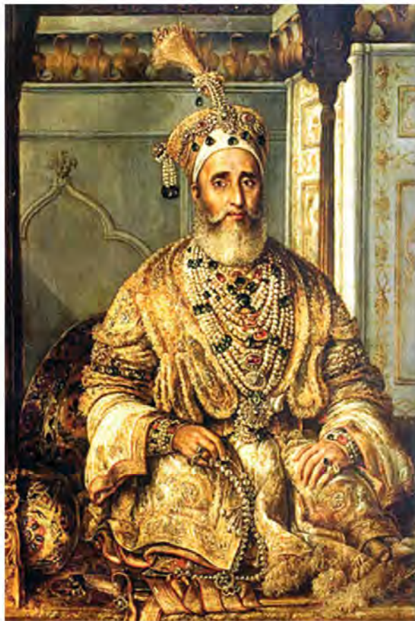
بهادرشاه دوم، آخرین فرمانروای گورکانی هند (۱۸۳۷-۱۸۵۷م) که کمپانی هند شرقی انگلستان او را از قدرت برکنار و به برمه تبعید کرد.