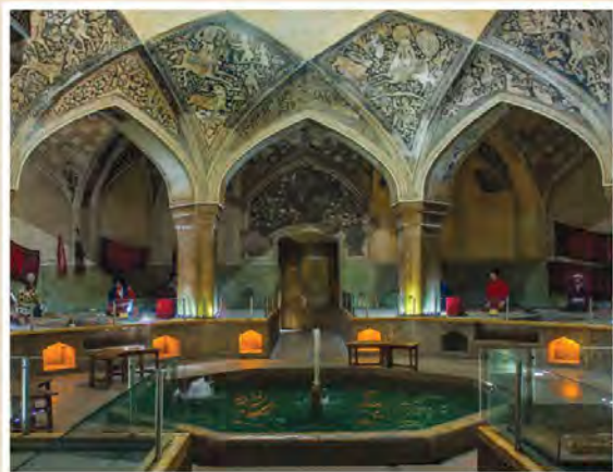
حمام وکیل - شیراز

کریم خان زند علاقه زیادی به ساختن بناهای باشکوه داشت. ساخت مجموعه مسجد و بازار و حمام وکیل، ارگ کریم خانی و بازسازی آرامگاه حافظ، سعدی و باغ دلگشا، گوشه‌ای از اقدامات عمرانی او در شیراز است. در دوره زند نوعی از بناها با کاربرد تفریحی گسترش یافت که به کلاه فرنگی معروف بود و آن بنایی کوچک و گاهی تزئینی بود که در وسط باغ‌ها یا تفریحگاه‌ها ساخته می‌شد (3) در نقاشی و نگارگری، به ویژه در عصر کریم خان زند، تحولی بزرگ به وجود آمد و نقاشان به تدریج هنر خود را با معیارهای هنری اروپا تطبیق دادند. مکتب نقاشی شیراز که در دوره مغولان شکل گرفته بود، در زمان زندیه به اوج رونق و زیبایی رسید و نقاشان برجسته‌ای مانند محمدصادق، اشرف و میرزا بابا آثار زیبایی آفریدند. (1)