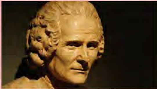
نگاره ژان ژاک روسو (۱۷۱۲-۱۷۷۸م)

در کنار این عوامل، تحولات فکری جامعه فرانسه نیز نقش بزرگی در پیدایش انقلاب داشت. در این کشور تحت تأثیر عصر روشنگری اروپا، فلاسفه و روشنفکرانی ظهور کردند که اندیشه‌های آنان مردم را به سوی انقلاب رهنمون ساخت. گروهی از این روشنفکران که به اصحاب دایره‌المعارف شهرت داشتند، با طرح مباحث علمی و ادبی شروع به انتقاد از وضع موجود کردند. (ولتر، مونتسکیو و روسو سه تن از مشهورترین روشنفکران فرانسه در این دوره بودند. ولتر از اطاعت انسان از عقل مادی و مبارزه با خرافات سخن می‌گفت. مونتسکیو از تفکیک قوای سیاسی و حقوق بشر دفاع می‌کرد. روسو نیز بر اهمیت انتخابات تأکید می‌کرد و تشکیل حکومت را حاصل قراردادی اجتماعی می‌دانست.) این‌گونه نظریات دیدگاه مردم فرانسه را تغییر داد. (غفلت لویی شانزدهم از احوال مردم از یک سو و تجملات و ولخرجی‌های او و درباریان از سوی دیگر آتش خشم مردم را شعله‌ور ساخت.)