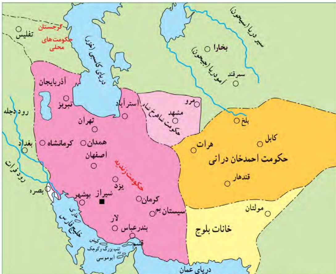
نقشه ایران در دوران زندیه

کریم خان، برخلاف سنت معمول، از پذیرفتن عنوان شاه امتناع کرد و خود را وکیل مردم ایران (وکیل الرعایا) ۱ خواند (بعضی از خصوصیات اخلاقی کریم خان مانند مدارا با دشمنان، همدردی با مردم، ساده‌زیستی و رفتار مناسب با اقلیت‌های دینی و مذهبی باعث شده است که نام و نشان نیکی از او در تاریخ ایران به جا بماند. 2 )