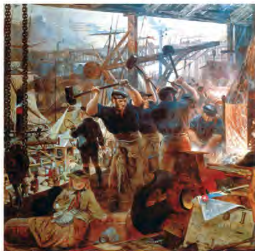
تابلوی آهن و زغال سنگ، اثر ویلیام بل اسکات، نقاش اسکاتلندی - اواسط سده ۱۹م

4- انقلاب صنعتی، دگرگونی جهان؛ تا اواخر قرن ۱۸م عامل اصلی تولید نیروی بازوی انسان بود. صنعتگران برای تولید کالای بیشتر، مهارت های فکری، جسمی و هنری خود را به کار می بستند و از دیگر نیروهای طبیعت، مانند آب و باد، کمتر استفاده می کردند. در انقلاب صنعتی نیروی محرکه آب و سپس بخار جایگزین نیروی جسمی انسان شد. 1 (این انقلاب با اختراع و تکمیل ماشین بخار در انگلستان آغاز گردید) اگر چه 2 (تراز شدن ثروت افسانه ای سرزمین های استعمار شده ای مانند هند و آمریکا (قبل از قرن ۱۸) و همچنین نظام گسترده برده داری و تجارت پرسود آن نیز، به شکل گیری انقلاب صنعتی کمک کرد) 2