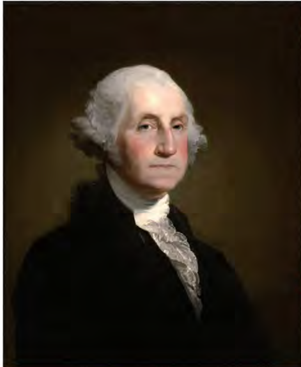
نگاره جورج واشینگتن (۱۷۲۲-۱۷۹۹ م)

استقلال آمریکا به پایان رسید (۱۷۸۳ م) و جورج واشینگتن ۱ به عنوان نخستین رئیس جمهور این کشور انتخاب شد (۱۷۸۹ م) ۴ (دولت آمریکا پس از استقلال این کشور با پیشروی به سوی غرب و کشتار وسیع سرخپوستان که ساکنان و صاحبان صدها ساله اصلی آمریکا بودند، سرزمین های وسیعی را تصاحب کرد. در جنوب هم، با اشغال سرزمین پهناوری از مکزیک، بزرگترین ایالت های جنوبی و جنوب غربی مانند کالیفرنیا و تگزاس را به ایالات خود افزود) ۲ . (این دولت همچنین با بهره گیری از نیروی کار بردگان آفریقایی اقتصاد خود را توسعه بخشید و در پایان سده ۱۹م به پیشرفت های وسیع سیاسی، اقتصادی و صنعتی دست یافت و به رقیبی برای کشورهای استعمارگر اروپایی تبدیل شد.) ۳