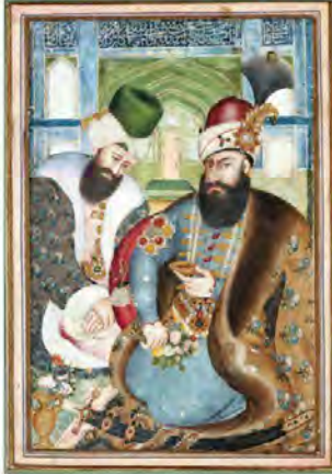
نگاره کریم خان زند هنگام دیدار با فرستاده عثمانی

2. برخی از خصوصیات اخلاقی کریم خان زند که از او نام و نشانی نیک در تاریخ به جا گذاشت را نام ببرید.