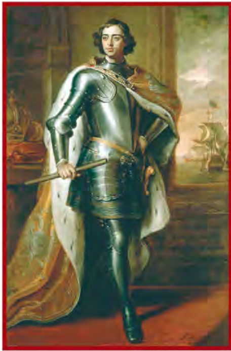
پتر کبیر، پدر روسیه جدید

۵- روسیه در مسیر توسعه طلبی نظامی؛ روسیه تا پیش از به قدرت رسیدن پتر کبیر (۱۶۸۲-۱۷۲۵م) در رقابت استعماری اروپاییان جایگاهی نداشت. اما سیاست و اقدام های پتر کبیر، این کشور را متحول کرد و در مسیر توسعه طلبی سیاسی و نظامی قرار داد. (و با استخدام کارشناسان اروپایی، تأسیس مدارس و دانشگاه های جدید و تقویت ارتش به ویژه نیروی دریایی، این کشور را وارد مسابقه استعمار کرد) (یکی از برنامه های پتر برای قدرتمند شدن روسیه، گسترش سرزمین روسیه و دستیابی به دریاهای آزاد برای کسب منافع تجاری و سیاسی بود). جانشینان او تلاش کردند به این برنامه عمل کنند و به همین سبب در نواحی شرقی اروپا و حوزه دریاهای بالتیک، سیاه و مازندران (خزر) اقدامات نظامی وسیعی انجام دادند. این اقدامات موجب جنگ های متعدد روسیه با ایران، عثمانی و برخی کشورهای اروپایی، نظیر فرانسه شد.