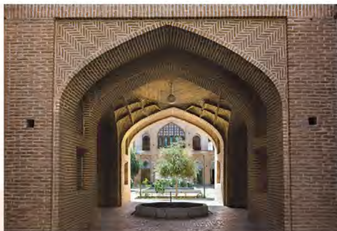
مدرسه علمیه خان یزد؛ این مدرسه به همت محمدتقی خان، والی خیراندیش یزد در سال ۱۱۸۶ ق بنا شد.

شعر و ادب فارسی در دوره زندیه تحول چشمگیری یافت که محققان از آن با عنوان «نهضت بازگشت ادبی» یاد کرده اند. چهره های برجسته این سبک ادبی به سبک خراسانی و شیوه شعری چون فرخی، عنصری، سعدی و حافظ شعر می سرودند.