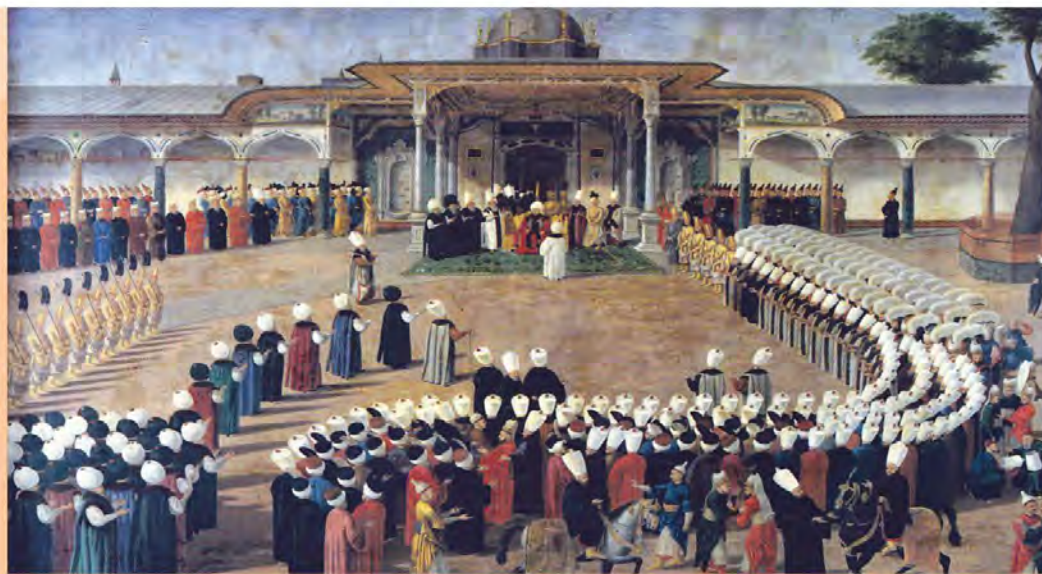
نگاره سلطان سلیم سوم (۱۷۸۹-۱۸۰۷ م) هنگام به حضور پذیرفتن مقام‌های امپراتوری در کاخ توپ‌کاپی - استانبول

2) سده‌های هفدهم تا نوزدهم میلادی دو سوی عالم وضعیت دوگانه متضادی داشت؛ در جانب شرق سه حکومت مسلمان یعنی ایران، عثمانی و گورکانیان هند دوران ضعف خود را سپری می‌کردند و در جانب غرب، امپراتوری‌ها و دولت‌های روسیه، فرانسه و انگلستان در مسیر قدرت و شکوفایی قرار داشتند (2) ضعف امپراتوری‌های مسلمان دلایل خاص خود را داشت. علل ضعف دولت‌های اسلامی به‌ویژه ایران، هند و عثمانی در قرون اخیر، از مهم‌ترین مسائلی است که همچنان بررسی‌ها درباره آن ادامه دارد. در این بررسی‌ها، چگونگی عملکرد و نقش استعمار غربی و همچنین کانون‌های داخلی وابسته به آن در بروز و تشدید عقب ماندگی دولت‌های بزرگ اسلامی، از اهمیت بیشتری برخوردار است.