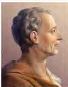
نگاره مونتسکیو (۱۶۸۹-۱۷۵۵م)