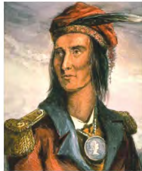
نگاره تکومسه (Tecumseh)، رهبر جنگجوی قبایل سرخ پوست که در برابر پیشروی سربازان آمریکایی مقاومت بسیاری کرد (اوایل قرن ۱۹ م).

با بررسی رفتار غیرانسانی سفیدپوستان آمریکا در قتل چند میلیون سرخ پوست که ساکنان اصلی آن سرزمین بودند و نیز بردگان سیاه پوست آفریقایی، میزان پایبندی آمریکا به اعلامیه استقلال را تجزیه و تحلیل کنید.