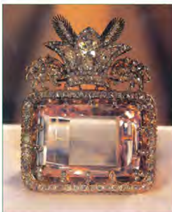
الماس دریای نور - موزه جواهرات ملی ایران

یکی از اقدامات نادر، لشکرکشی به هندوستان و جنگ کرنال بود. او به بهانه تعقیب افغان‌ها و اعتراض به اینکه پادشاه گورکانی هند، به آنها پناه داده است، به این کشور لشکرکشی کرد. البته برای این کار انگیزه مالی و اقتصادی نیز داشت؛ چون اداره ارتش بزرگ و پرشمار او بدون منابع مالی کافی ممکن نبود. نادر با پیروزی در جنگ کرنال، دهلی را تصرف کرد و به غنایم گران‌بهای همچون الماس دریای نور، تخت طاووس و گنجینه‌های بزرگ جواهرات و کتب نفیس دست یافت و آنها را به همراه هزاران هنرمند و صنعتگر هندی با خود به ایران آورد.