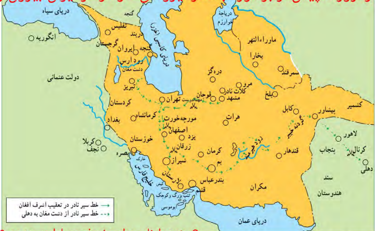
نقشه لشکرکشی‌ها و جنگ‌های نادر