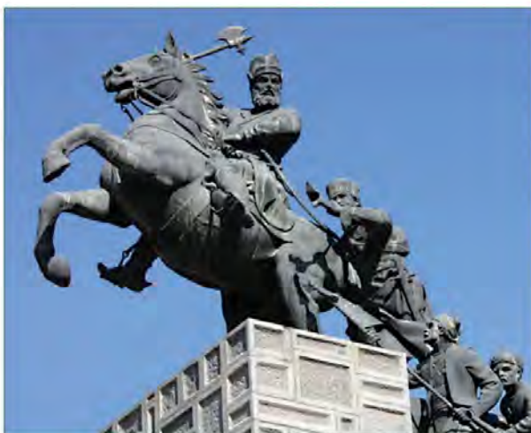
مجسمه نادرشاه افشار - باغ نادری - مشهد