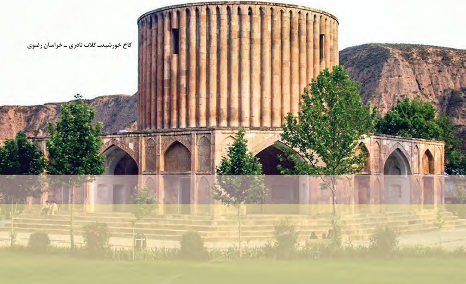
کاخ خورشید - کلات نادری - خراسان رضوی

به علت آشفتگی سیاسی و اجتماعی کشور پس از صفویان، امکان رشد و ترقی هنر و معماری دور ۱ انتظار بود. با این حال، در زمان حکومت نادر شاه و دوره استقرار کریم خان زند در شیراز اقدامات قابل توجهی صورت گرفت. ۲ (ورود هنرمندان و صنعتگران هندی پس از فتوحات نادر در هند، موجب تلفیق هنر ایرانی و هندی شد.) ۱ (مدارا و احترام کریم خان نسبت به هنرمندان و علما نیز موجب رونق هنر و معماری در زمان او شد.) ۲ در دوره نادر شهر اصفهان بازسازی شد و در منطقه کلات که محل نگهداری خزاین نادر بود، بناهای باشکوهی مانند کاخ خورشید ساخته شد. ۳