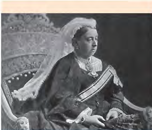
ملکه ویکتوریا (۱۸۱۹-۱۹۰۱ م)

کشورهای اروپایی در سده‌های پس از عصر رنسانس شاهد انقلاب‌های سیاسی بزرگی بودند که به تغییرات سیاسی و اجتماعی عمیق و بنیادینی در این کشورها منجر شد (ظهور انقلاب صنعتی نیز تحولات مهمی در پی داشت که شتاب گرفتن و گسترش استعمار ۲ از جمله آنها بود.) ۱