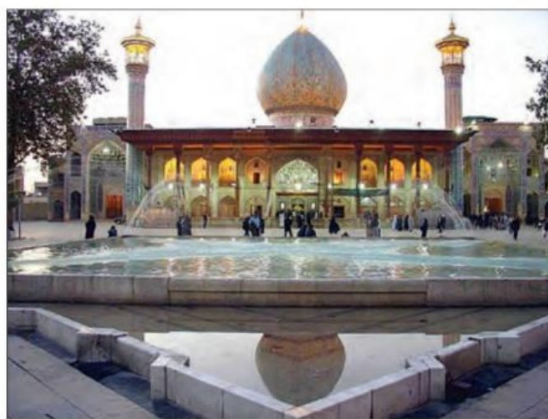
حرم حضرت شاهچراغ علیه السلام - شیراز