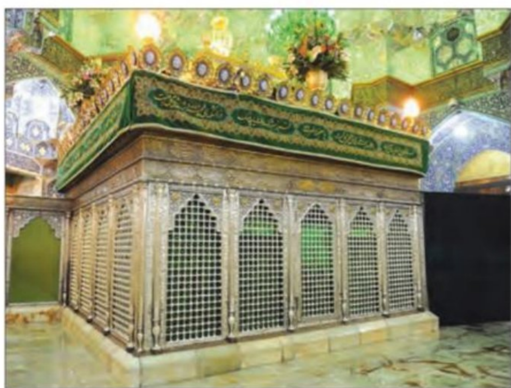
ضریح حرم حضرت معصومه علیها السلام - قم

۱۸ ( الف) اسلام دینی جهانی است و تمام مردم جهان مخاطب آن به‌شمار می‌روند. پیام برادری و برابری اسلام و سادگی مناسک و آداب اسلامی، از جمله جذابیت‌های این دین برای ایرانیان بود. ب) ساکنان ایران، خواه زرتشتی و خواه مسیحی و یهودی، یکتاپرست و معتقد به بهشت و جهنم و ظهور منجی بودند؛ بنابراین، درک و پذیرش جهان‌بینی توحیدی و پیام مکتب اسلام، برای آنان چندان دشوار و ناخوشایند نبود.