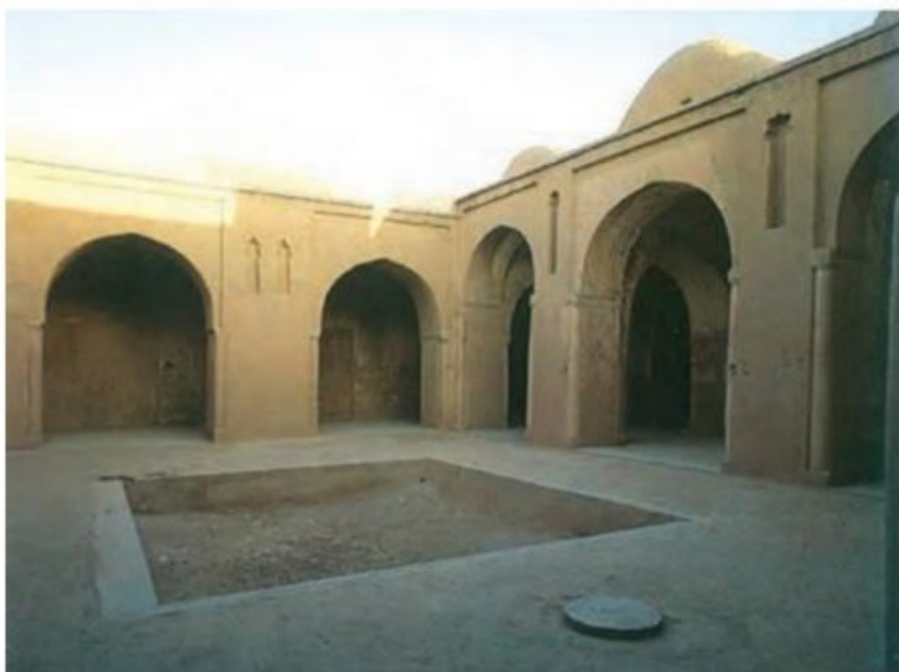
مسجد فهرج - یزد

صلح‌نامه‌هایی که میان ایرانیان و اعراب مسلمان در جریان فتح ایران منعقد شد، حاوی چه شواهدی دربارهٔ روند اسلام‌پذیری مردم ایران هستند؟