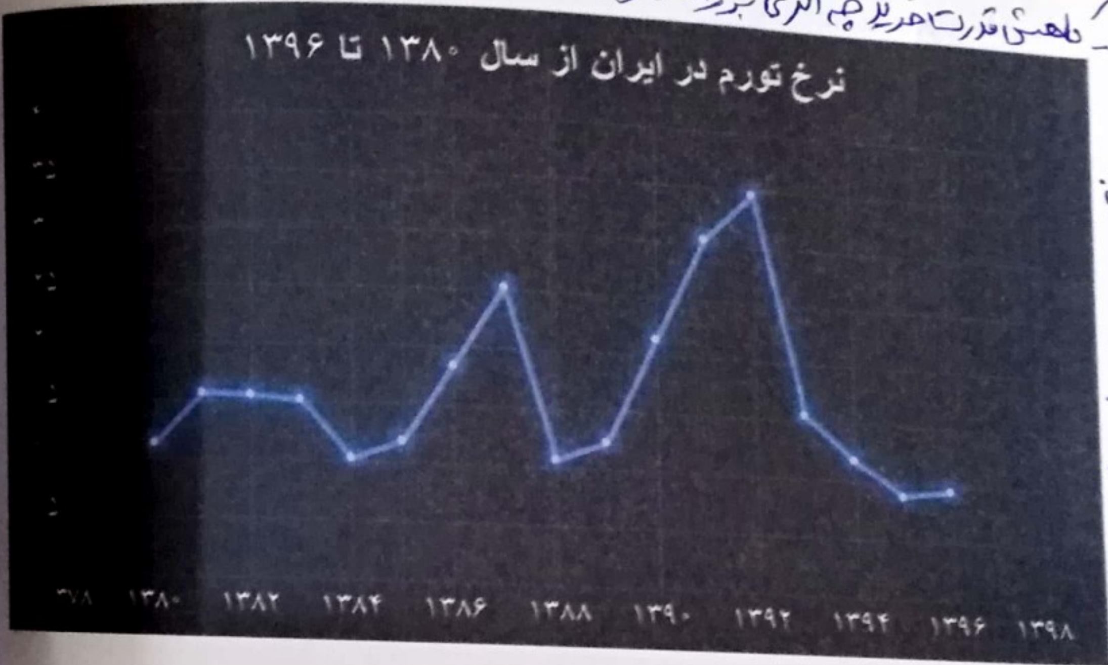
نمودار تورم در ایران - سال پایه ۱۳۹۵