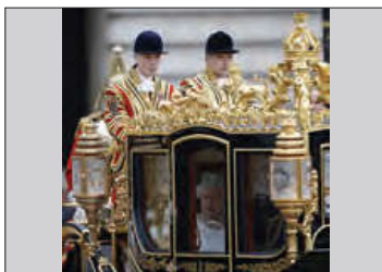
■ مشروطه سلطنتی انگلستان

گفته شد که جهان اجتماعی دارای هویت سیاسی است. جهان اجتماعی با پذیرش یک نظام سیاسی خاص، هویت سیاسی پیدا می کند. نظام های سیاسی انواع گوناگونی دارند. با چه ملاک هایی می توان نظام های سیاسی را دسته بندی کرد و چه انواعی برای نظام های سیاسی وجود دارد؟