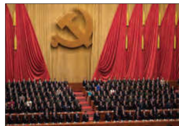
■ حزب کمونیست چین