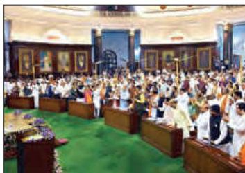
■ پارلمان هند