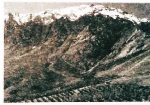
رشته کوه زاگرس