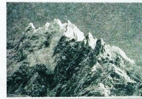
رشته کوه البرز

کرج ، کر ، زاینده رود، کارون، سیمینه رود، تلخه رود، چالوس، جاجرود، کرخه، کرج، زرینه رود، گرگان