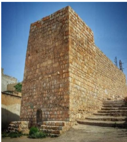
آسیاب گبری از مکانهای تاریخی استان لرستان