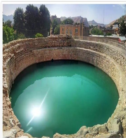
گرداب سنگی (خرم آباد)