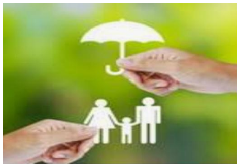
حق رفاه و تأمین اجتماعی»

همه شهروندان حق دریافت خدمات عمومی به صورت برابر و عادلانه و در کوتاه ترین زمان ممکن را دارند.