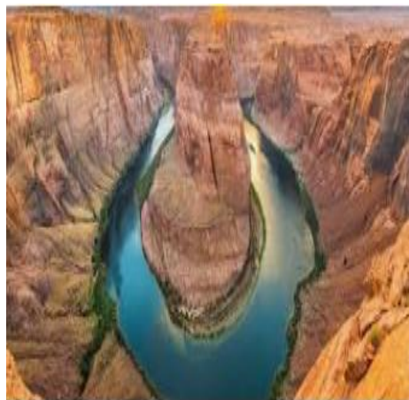
دره خزینه (بلدختر)