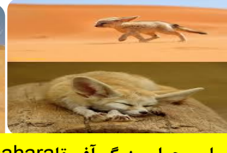
روباه صحرای بزرگ آفریقا saharal