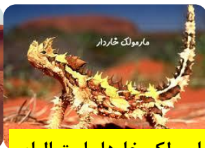
مارمولک خاردار استرالیایی