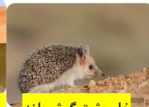
خار پشت گوش بلند