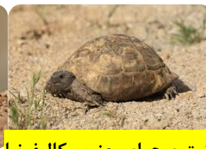
لاک پشت صحرای جنوب کالیفرنیا