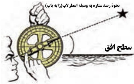
نحوه رصد ستاره به وسیله اسطرلاب (زاویه یاب)