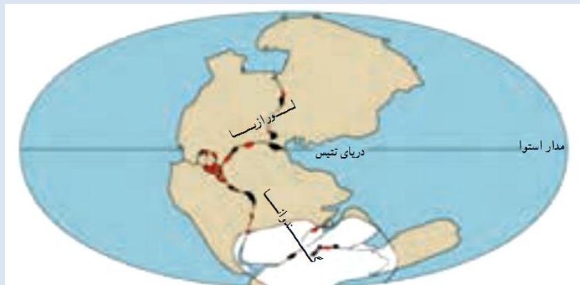
شکل ۲ - موقعیت خشکی های لورازیا و گندوانا و دریای تتیس

در زمان های گذشته در سطح زمین فقط یک قاره به نام پانگه آ و یک اقیانوس به نام پانتالاسا وجود داشته و سپس خشکی بزرگ پانگه آ توسط دریای تتیس به دو خشکی گندوانا و لورازیا تقسیم شده است. بعد از آن حرکت ورقه های زمین بر روی نرم کره باعث جدایی قاره های مختلف شده است.