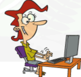
Surf the internet