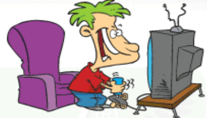
Play video games