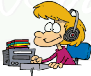
Listen to music