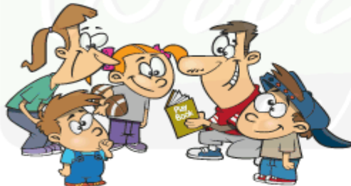
Spend time with the family