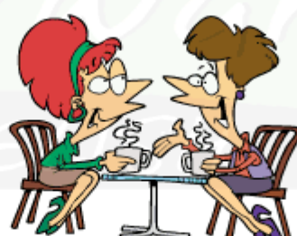
Go out with friends