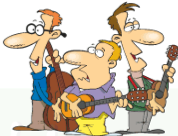
Play an instrument