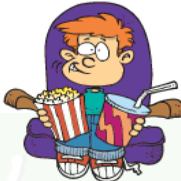
Go to the movies