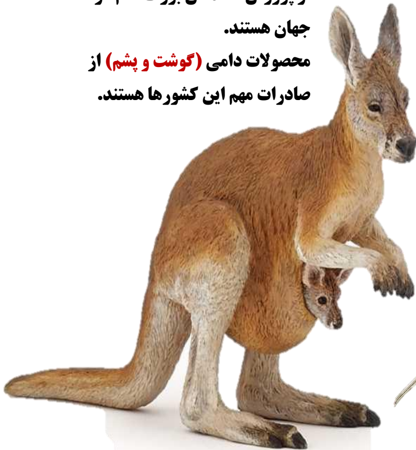
کانگورو، نماد کشور استرالیا

از پرورش دهندگان بزرگ دام در جهان هستند. محصولات دامی (گوشت و پشم) از صادرات مهم این کشورها هستند.