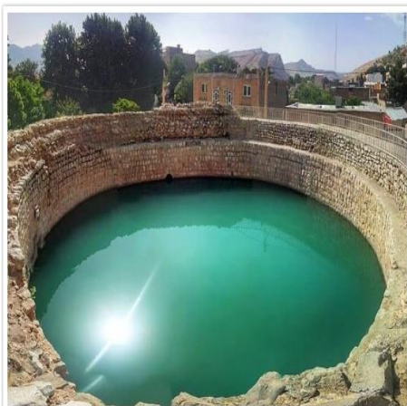
گرداب سنگی (خرم آباد)