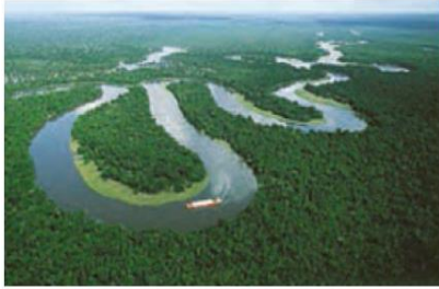
رود آمازون، آمریکای جنوبی

رود آمازون پر آب ترین رودخانه جهان در جنگل های استوایی در آمریکای جنوبی جریان دارد.