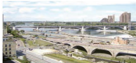
رود می سی سی پی، ایالات متحده آمریکا

رود می سی سی پی در آمریکای شمالی به خلیج مکزیک می ریزد، این رود نقش مهمی در حمل و نقل کالا، منابع و تجارت از طریق کشتیرانی دارد.