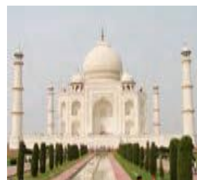
تاج محل در هندوستان

۳. الف) درباره بازی های آسیایی چه می دانید؟ بازی های آسیایی که آسیاد هم خوانده می شود، رویدادی چند ورزشی است که هر ۴ سال یکبار بین ورزشکاران کشورهای مختلف سراسر قاره آسیا برگزار می شود. نخستین دوره این بازی ها در سال ۱۹۵۰ میلادی در دهلی هند برگزار شد، دومین دوره بازی های آسیایی به فاصله ۳ سال از دور اول اجرا شد؛ اما بعد از آن دوره، بازه زمانی ۴ سال یکبار تا به امروز رعایت شده است.