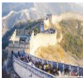
دیوار بزرگ چین

۲. حدس بزنید، این تصاویر کدام جاذبه های گردشگری آسیا هستند؟