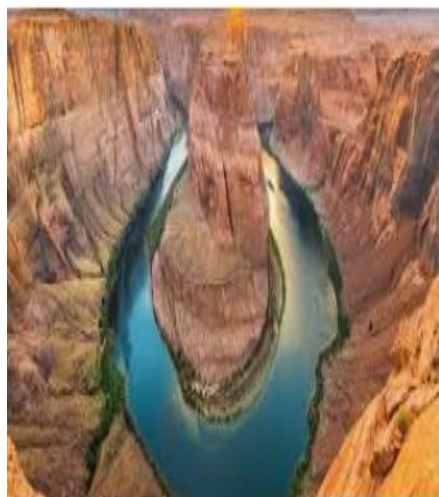
دره خزینه (پلدختر)