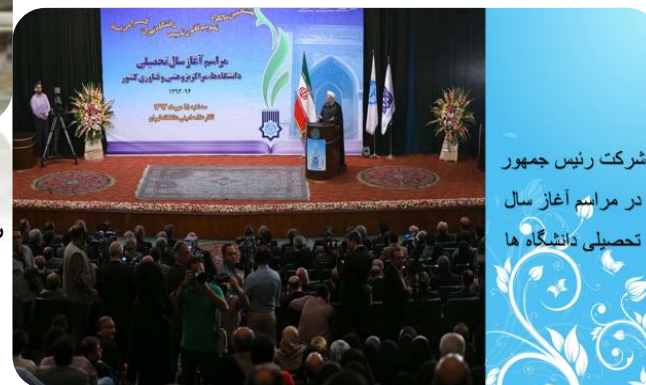
شرکت رئیس جمهور در مراسم آغاز سال تحصیلی دانشگاه ها