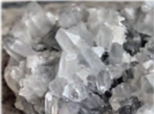
کوارتز (SiO 2 )