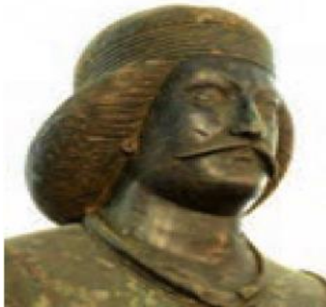
مجسمه مرد پارتی (اشکانی)

پارت ها نیز یکی از اقوام آریایی بودند. رئیس یکی از قبایل پارت ملقب به اشک یا ارشک با هدف مقابله با سلوکیان، پارتیان و دیگر اقوام ایرانی را متحد کرد. او با استفاده از اختلافات سلوکیان توانست قسمت هایی از ایران را آزاد کند. مورخان وی را مؤسس سلسله اشکانی می دانند.