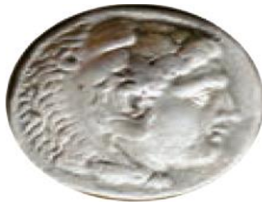
سکه با نقش اسکندر مقدونی

پس از مرگ اسکندر، قلمرو پهناور او میان سردارانش تقسیم شد. ایران به دست سلوکوس، یکی