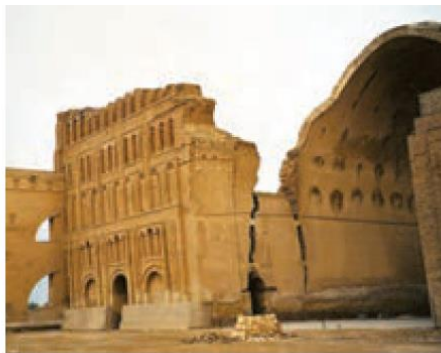
بنای طاق کسری که بخشی از کاخ پادشاهان ساسانی بود و امروز در کشور عراق قرار دارد