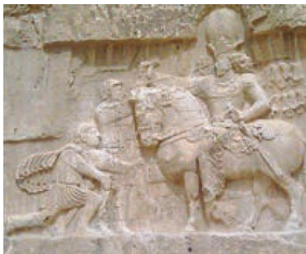
سنگ نگاره بیروزی شاپور ساسانی بر والرین امپراتور روم در نقش رستم، استان فارس

برای تعیین زمان رویدادهای قبل از میلاد حضرت مسیح (ع) نیز تقویم میلادی به صورت معکوس و با علامت اختصاری (ق. م) به کار می رود. برای مثال ۸۰۰ ق.م، بیانگر هشتصد سال پیش از میلاد مسیح است.