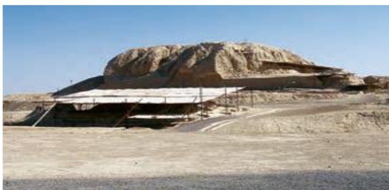
تپه سیلک کاشان

با گذشت زمان، جمعیت برخی سکونتگاه ها رو به افزایش گذاشت و شهرهایی پدید آمدند که به وسیله حکومتی اداره می شدند. آنها قوانین و مقرراتی برای خود وضع کردند مردم این شهرها در هنر و معماری و ساختن بناها پیشرفت زیادی کردند. بدین ترتیب نخستین «تمدن های» بشری به وجود آمدند.