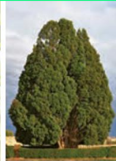
درخت سرو (کهنسال ترین موجود زنده ایران)، ابرکوه، یزد