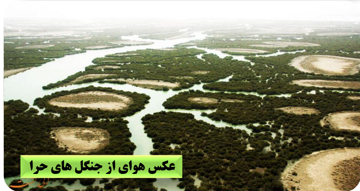
عکس هوای از جنگل های حرا