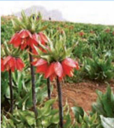
دشت لاله های وازگون - چهارمحال و بختیاری

حشرات ایران را حدود ۶۰،۰۰۰ گونه تخمین زده اند