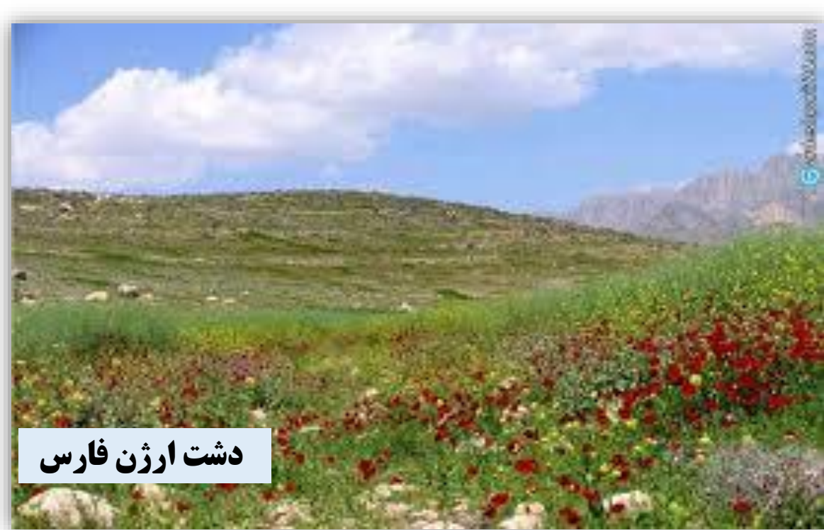
دشت ارژن فارس