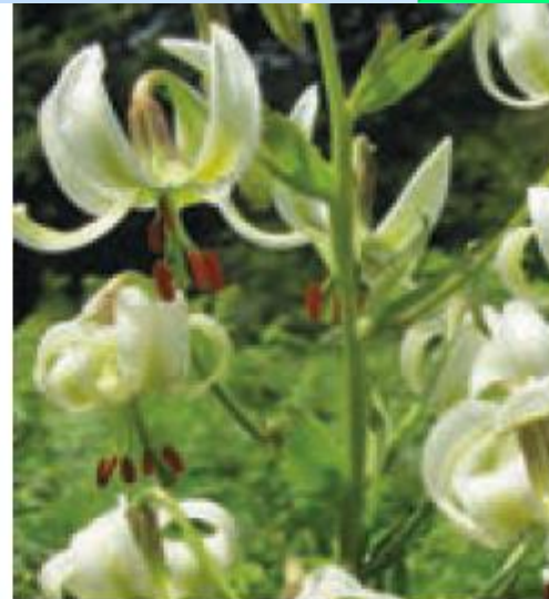
سوسن چلچراغ - گیلان