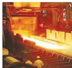
ت) تولید ورقه های فلز آهن

۴. چگونه اتم های اکسیژن موجود در اکسید آهن را برای خالص سازی آهن، جدا می کنند؟ برای جدا کردن اتم های اکسیژن، سنگ معدن را به همراه کربن (ذغال کُک) در کوره های مخصوص حرارت می دهند. در اثر این عمل، اتم های اکسیژن از سنگ معدن جدا شده و به صورت کربن دی اکسید خارج می شوند. در نتیجه فلز آهن به حالت مذاب در ته کوره باقی می ماند.