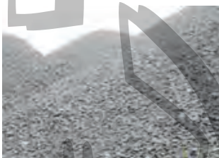
ب) خالص سازی سنگ معدن آهن