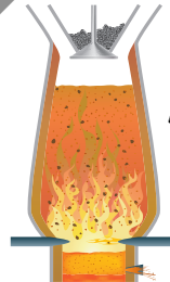
پ) گرما دادن مخلوط سنگ آهن، کربن و آهنک در کوره