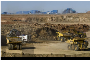
الف) شناسایی معدن و استخراج سنگ آهن

۳. چه مراحل برای تهیه آهن از سنگ معدن باید انجام گردد؟ الف) شناسایی معدن و بیرون آوردن سنگ معدن از دل زمین و انتقال آن به کارخانه - ب) خالص سازی سنگ معدن - پ) گرما دادن مخلوط سنگ آهنک، کربن و آهنک در کوره - ت) تولید ورقه های فلز آهن