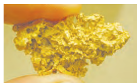
طلا به صورت تکه ها و رگه های درخشان در بین برخی سنگ ها و خاک ها یافت می شود