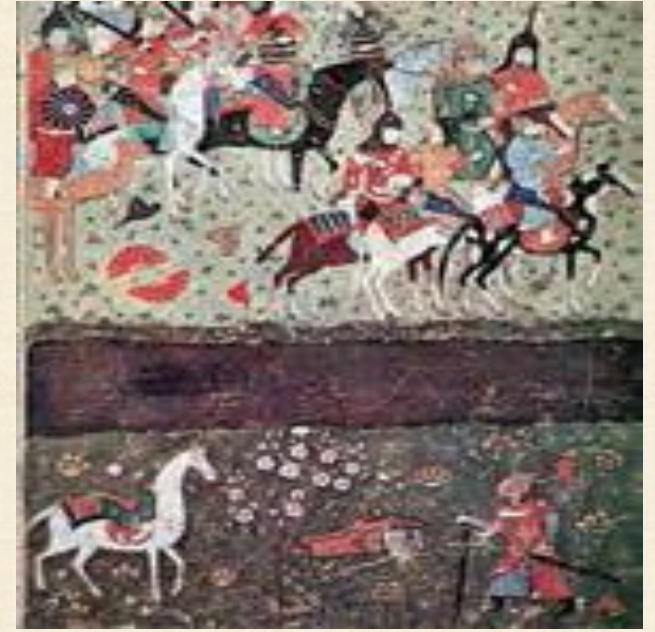
نقاشی مینیاتور، حمله ی مغول و فرار سلطان محمدخوارزمشاه