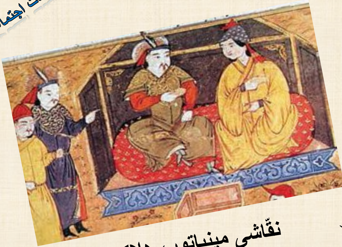
نقاشی مینیاتور، هلاکوخان