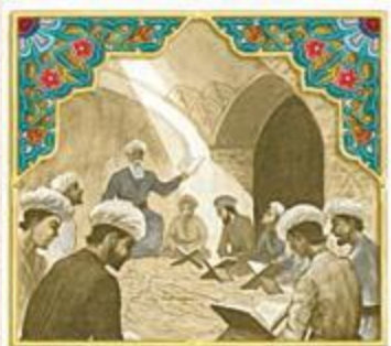
نقاشى مدرسه ی نظامیه

در این دوره، همچنین مساجد، برجها، مناره ها و کاروان سراهاى باشکوهی، بنا شدند .