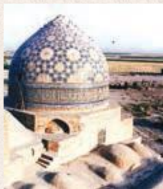
مسجد جامع ساوه

در این دوره، همچنین مساجد، برجها، مناره ها و کاروان سراهاى باشکوهی، بنا شدند .