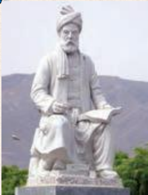
فردوسی شاعر بلند آوازه ی ایرانی

در دوره ی حکومت های ترک تبار به ویژه سلجوقیان، زبان و ادب فارسی مورد توجه قرار گرفت و در قلمرو پهناور آن ها رواج یافت.