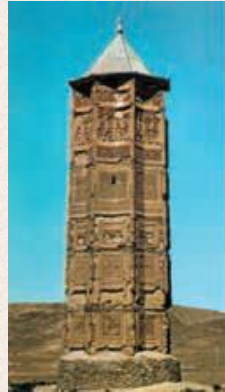
مناره ی دوره ی غزنویان غزنین، افغانستان