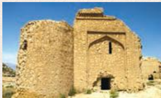
کاروان سراى رباط قره عشق، خراسان شمالی