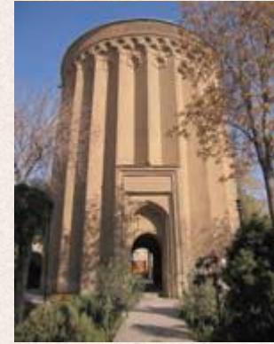
برج طغرل در شهر ری