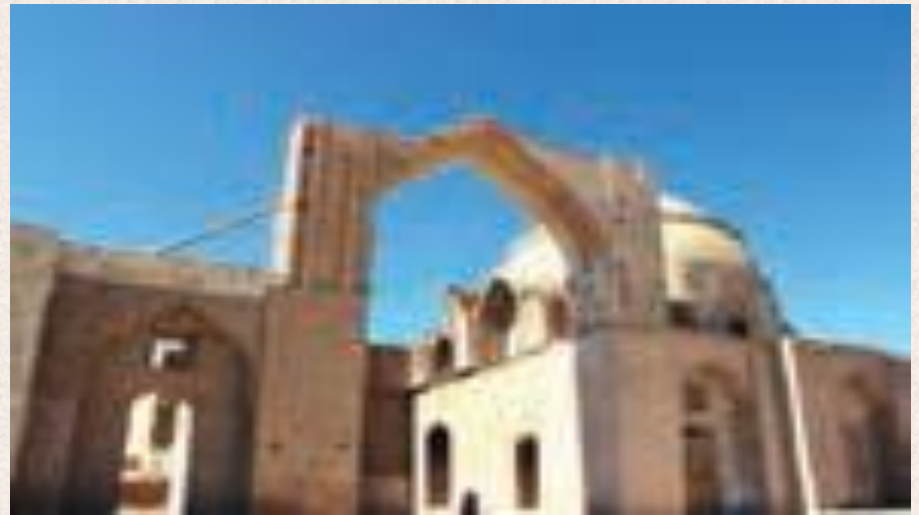
مسجد جامع رُشتخوار، استان خراسان رضوی