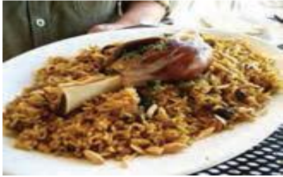
غذای محلی عراق

در طول هزاران سال، تمدن های بسیاری مانند سومر، آکد و آشور، در سرزمین بین النهرین (میان دو رود دجله و فرات) به وجود آمدند. به همین دلیل، در این کشور بناها و آثار باستانی زیادی وجود دارد.