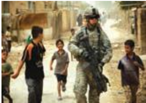
حضور نظامیان در عراق

عراق کشوری نفت خیز است و از تولید و صادرات نفت، درآمدزایی دارد. مهم ترین محصول کشاورزی عراق، خرماست و در این کشور، نخلستان های زیادی وجود دارد.