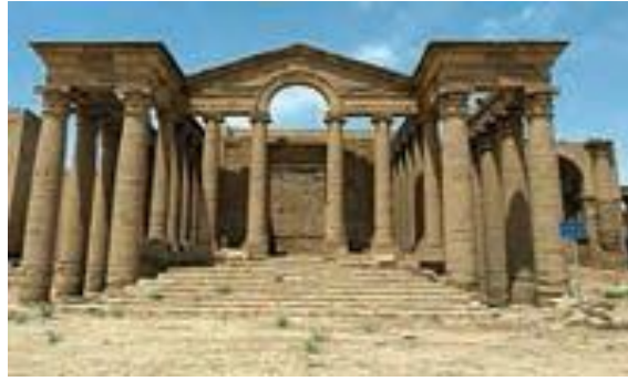
شهر تاریخی نمرود در نزدیکی موصل

غذای مشهور مردم عراق «المُطَبَّک» است که از گوشت و برنج تهیه می شود. نوعی شیرینی هم که با آرد، روغن، شکر، خرما و کنجد درست می شود، در بین بچه ها طرفدار زیادی دارد.