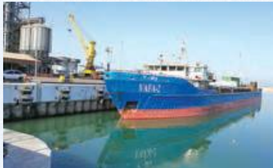
بندر امیرآباد مازندران