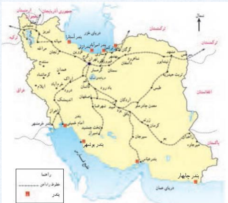
نقشه ی شبکه ی حمل و نقل راه آهن و بنادر تجاری ایران

به نقشه ی راه آهن سراسری ایران نگاه کنید. راه آهن ایران علاوه بر حمل مسافران، کار جابه جایی کالاها را هم انجام می دهد. حمل بارهای سنگین با قطار باربری، ارزا نتر تمام می شود. به علاوه، قطار در مقایسه با کامیون مقدار بیشتری کالا را حمل و جابه جا می کند.