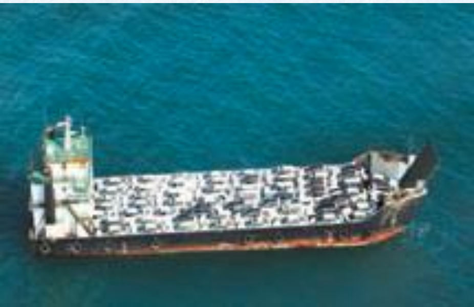
کشتی باری بندر عباس

● حمل و نقل آبی: هما نظر که می دانید، کشور ما از شمال و جنوب به دریا راه دارد و ما می توانیم از این طریق با کشورهای دیگر ارتباط برقرار کنیم. حمل و نقل با کشتی و از راه دریا بسیار ارزان است. کشتی ها برای حمل کالاهای سنگین، بسیار مناسب اندولی خیلی آهسته حرکت می کنند. علاوه بر این، همه ی کشورها به دریا دسترسی ندارند.