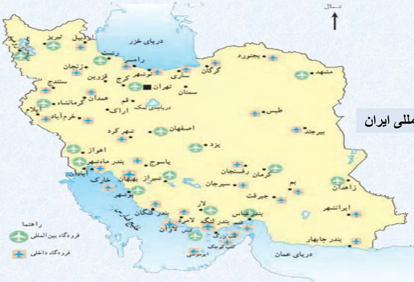
نقشه ی فرودگاه های داخلی و بین المللی ایران

به نقشه ی فرودگاه های ایران توجه کنید. با هواپیما می توانیم به بعضی از شهرهای داخل یا خارج از کشور سفر کنیم. بعضی از شهرها فرودگاه بین المللی دارند و پروازهای خارجی از این فرودگاه ها انجام می شود.