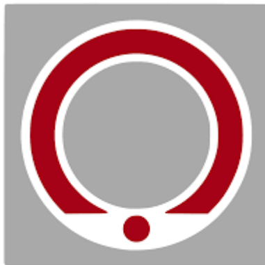
سازمان انتقال خون ایران