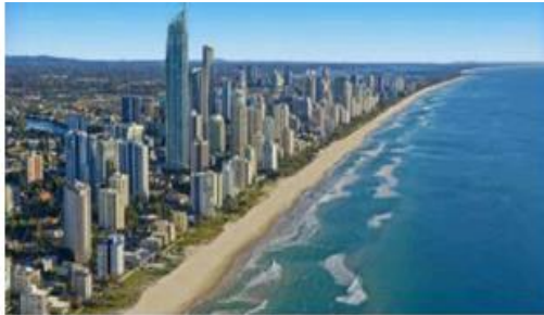
ساحل اقیانوس آرام، کورنیزلند، استرالیا

متن سوال تصور کنید نسبت خشکی ها و اقیانوسها برابر می شد . اگر این اتفاق رخ می داد . پیش بینی شما از این وضعیت چه خواهد بود ؟ و راهکار شما برای ان چیست ؟