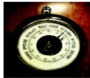
فشارسنج جیوه ای

2: بتواند با فشار سنج جیوه ای هوای کلاس خود را اندازه گیری کند.