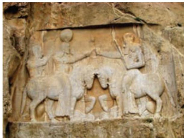
نقش برجسته بخشیدن حلقه شاهی از سوی اهورا مزدا به اردشیر ساسانی (نقش رستم)