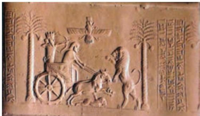
مهر سلطنت داریوش هخامنشی، طول مهر ۳/۵ سانتی متر است. در موزه بریتانیا در لندن نگهداری می‌شود. اسم داریوش روی مهر به سه خط ایلامی، پارسی و بابلی نوشته شده است.

(شاهان بر امور اداری، نظامی و مذهبی فرمانروایی مطلق داشتند. آنها برای اداره کشور فرمان‌هایی صادر می‌کردند). این فرمان‌ها، قانون‌هایی بودند که باید در سراسر کشور اجرا می‌شدند و هیچ‌کس نباید از آنها سرپیچی می‌کرد. روی فرمان‌ها و نامه‌های مهم، مهرهای مخصوص شاه زده می‌شد.