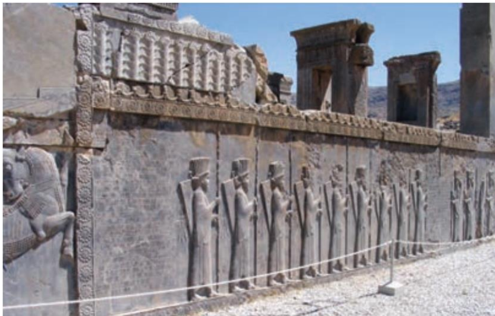
نقش برجسته سربازان سپاه جاویدان در تخت جمشید، استان فارس