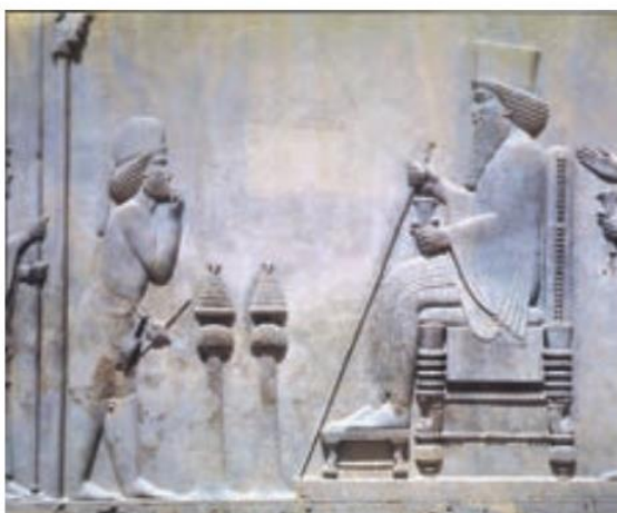
نقش برجسته داریوش در تخت جمشید

(در ایران باستان شیوه حکومت پادشاهی بود. شاهان در ابتدای سلطنت در حضور بزرگان کشور، تاج‌گذاری می‌کردند و در کاخ بر تخت می‌نشستند. شاه قدرت مطلق داشت و همه باید از او فرمان می‌بردند. حکومت موروثی بود و معمولاً از پدر به پسر به ارث می‌رسید) البته گاهی بر سر جانشینی شاه و به دست آوردن قدرت، اختلافات شدیدی پیش می‌آمد و حتی منجر به کشته شدن افراد زیادی و جنگ و خون‌ریزی می‌شد.