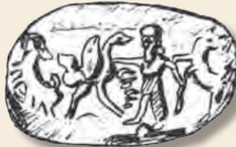
چند نمونه مهرهای مخصوص صاحب منصبان دوره هخامنشی