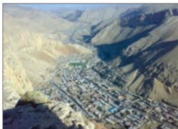
شکل ۸ - ماکو - آذربایجان غربی

به تصاویر مربوط به دو سکونتگاه توجه کنید. چه عاملی بر گسترش این سکونتگاه ها اثر دارد؟ این عامل بر نحوه گسترش این سکونتگاهها، چه تأثیری داشته است؟